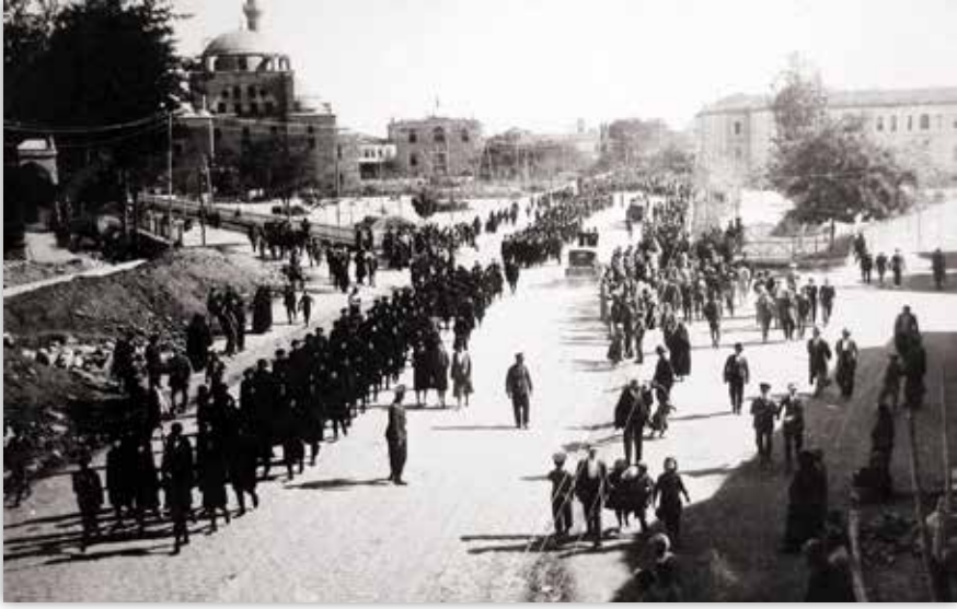
Kız Muallim Mektebi

üzerine sarı yıldızla yazılan “ Lise ” levhası asıldı.