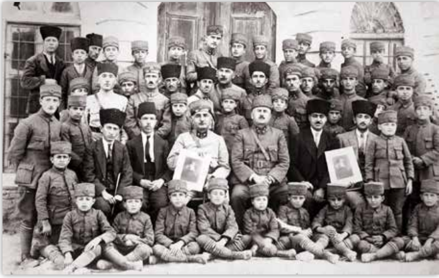
Kazım Karabekir Paşa ve Elazığlı Yetimlerin Konya Ziyareti, 23 Ağustos 1923

soba yakılırdı. Hiç unutmam çok soğuk bir kış günü yakılan sobanın hiç faydası olmuyordu. Yemekten sonraki tenefüste yirmi yedi arkadaş odunluk civarında toplandık. İki arkadaşı odunluk penceresinden içeri sokarak odun çaldık ve bunları boş sıraların gözüne yerleştirdikten sonra sobayı da kızarcıncaya kadar yaktık. Az sonra mütalaaya gelen nöbetçi öğretmen başöğretmen Fazıl Bey meraktan duramayarak hademeyi çağırıp niçin bu kadar fazla yaktığına darıldı. Tabii adamcağız kendisinin yakmadığını söyleyerek gittikten sonra fazıl Bey arka boş sıralardan birinin kapısını tesadüf açıp ta istif edilmiş odunları görünce derhal herkes sıra kapaklarını açsın dedi. Hepimiz açtık. Tabii hiç birimiz kendi oturduğumuz sıra içine odun saklamadığımızdan suçluyu tespit edemedi. Bütün sınıf suçlu görülerek tekrar hademeyi çağırarak bir kova su getirtti. Sobayı söndürdükten sonra sınıfın karşılıklı bütün pencerelerini açtırarak ve hiç birimize palto giydirmeyerek son ve sabah mütalaalarını bu şekilde yaptırmak suretiyle cezalandırdı. Ve zannederim birkaç arkadaş zatürreden yatıp kaldılar.