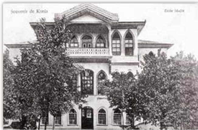
Konya Mektebi İdadisi