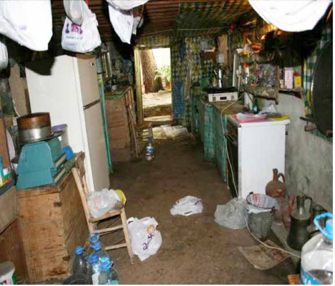
İzbenin içinden dışarıya bir bakış. Hayattaki tarihî ağacın alt tarafı da görülüyor.

kolaylaşırdu. Derken bir de ispirto ocağı adı verilen başka bir pişirme aleti kardeş oluverdi.. Bu ocaklar da zamanla yerini da ileri teknolojinin ürünlerine teslim ediverdi. İlk yıllarda milangaz ocağı diye anılan iki, bazısı üç gözlü ocaklar mutfaklarda bir devrim yapivermişti.