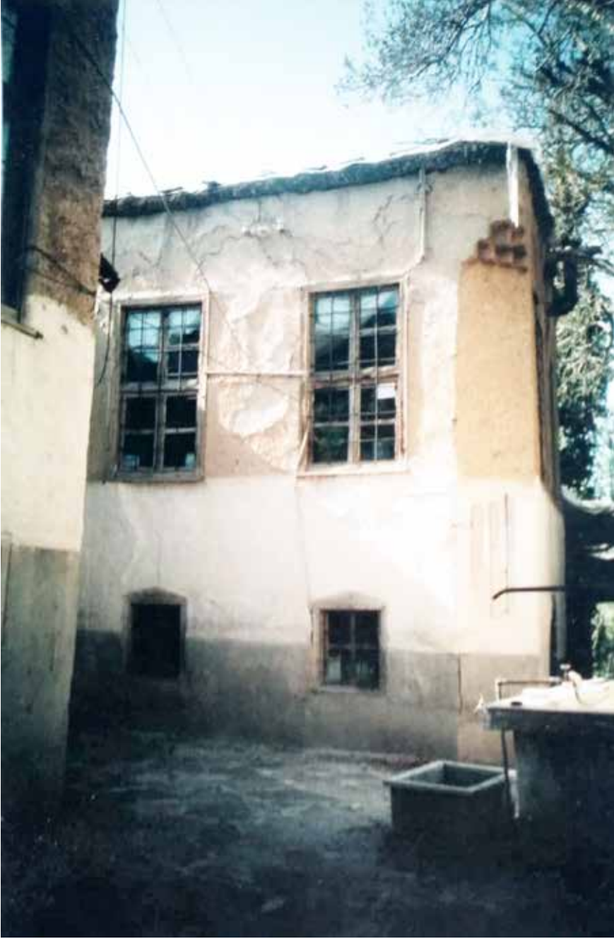
Altteki pencereler izbenin, üsttekiler ise başodanıdır.

mizde oluşturulan ortamda kalıplarının içinde bir süre bekletilir, zamanla kalıplarından çıkarılır ve evimizin korunaklı bir yerinde toplanırdı. Derken piyasaya yeni bir ocak türü sürülürdü: