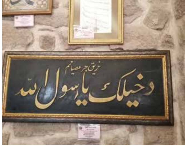
Sahipata Vakıf Müzesi (Dahilek ya Rasulallah)