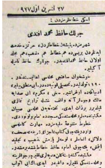
Çolak Hafız Efendi