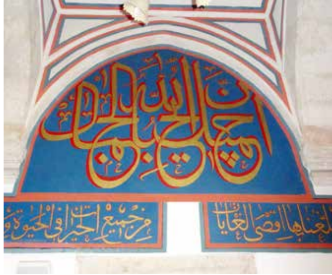
Şerafettin Camii, Mahbub Efendi.

Niyeti sala için fark bil de bir kadekesa biz.