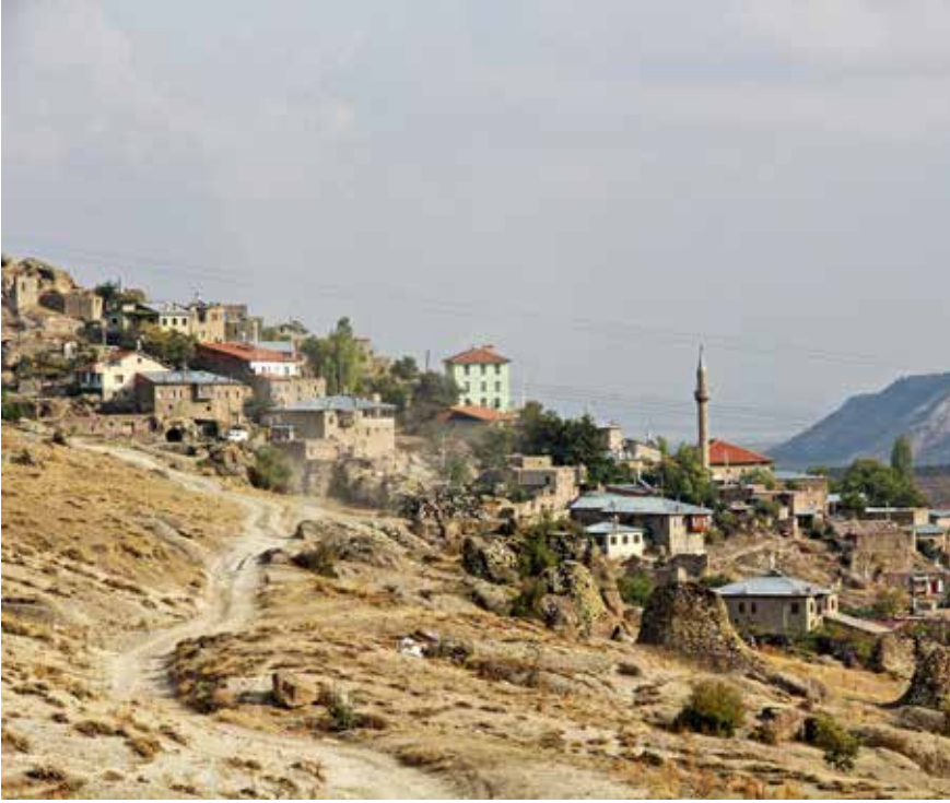
Günümüzde Gökuyurt (Kilistra) Mahallesi'nden bir görünüm

öküze bir eyer vurup Şam'a gideceğim" demiş. Babası ve köylüler Fikret'i zor durdurmuşlar.