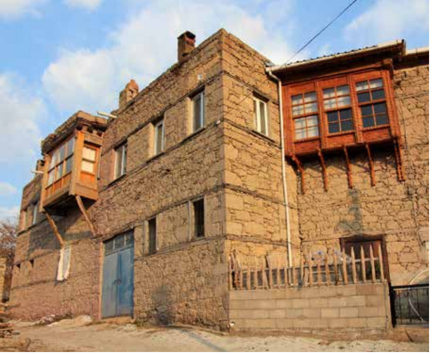
Günümüzde Gök yurt (Kilistra) Mahallesi'nde bulunan geleneksel bir ev