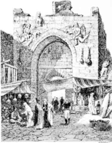
Sekil 3. Konya, 1840'de meleklerle süslü Pazar Kapısı.