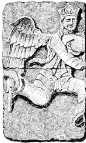
Sekil 4. Konya, Müzesinde Pazar Kapısından gelen Melekler (Krecker tarafından çizilmiştir).