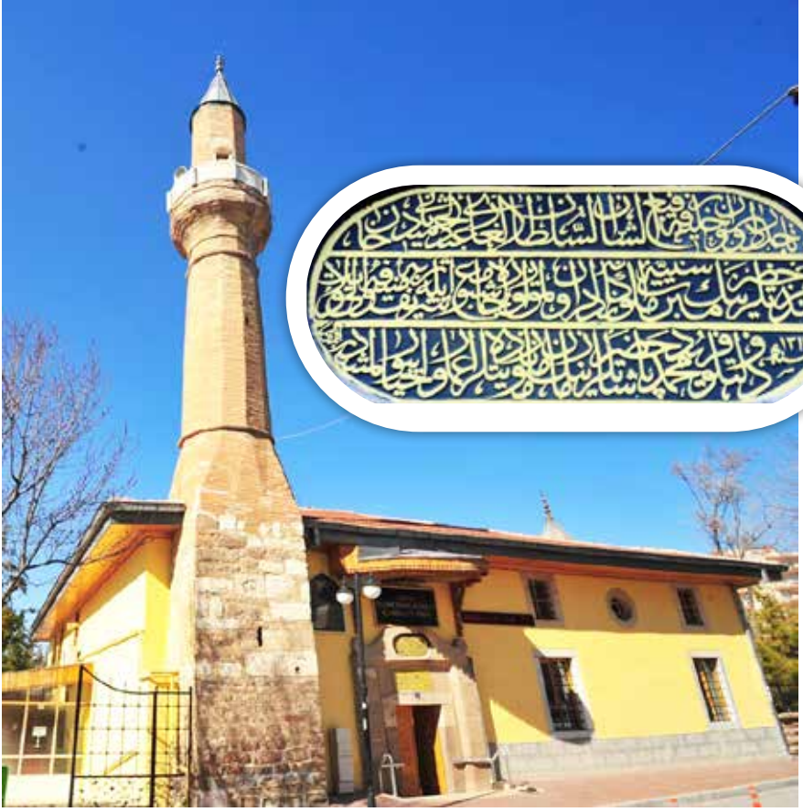
Sadreddin Konevi Cami ve kitabe

İslam'ı sağlam ve güvenilir kaynaklardan öğretmeyi seviyordu.