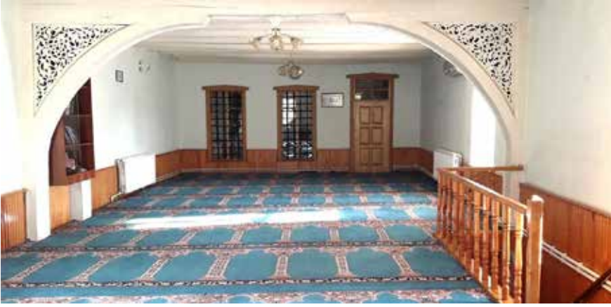
Sadreddin Konevi kütüphanesi