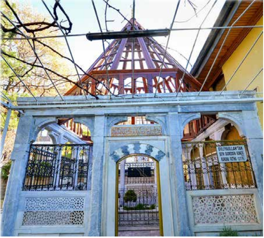
Sadreddin Konevi türbesi

kıh, tefsir, hadis ve benzeri kitaplar ise Şam'a götürülerek oraya vakfedilsin (bağışlansın).