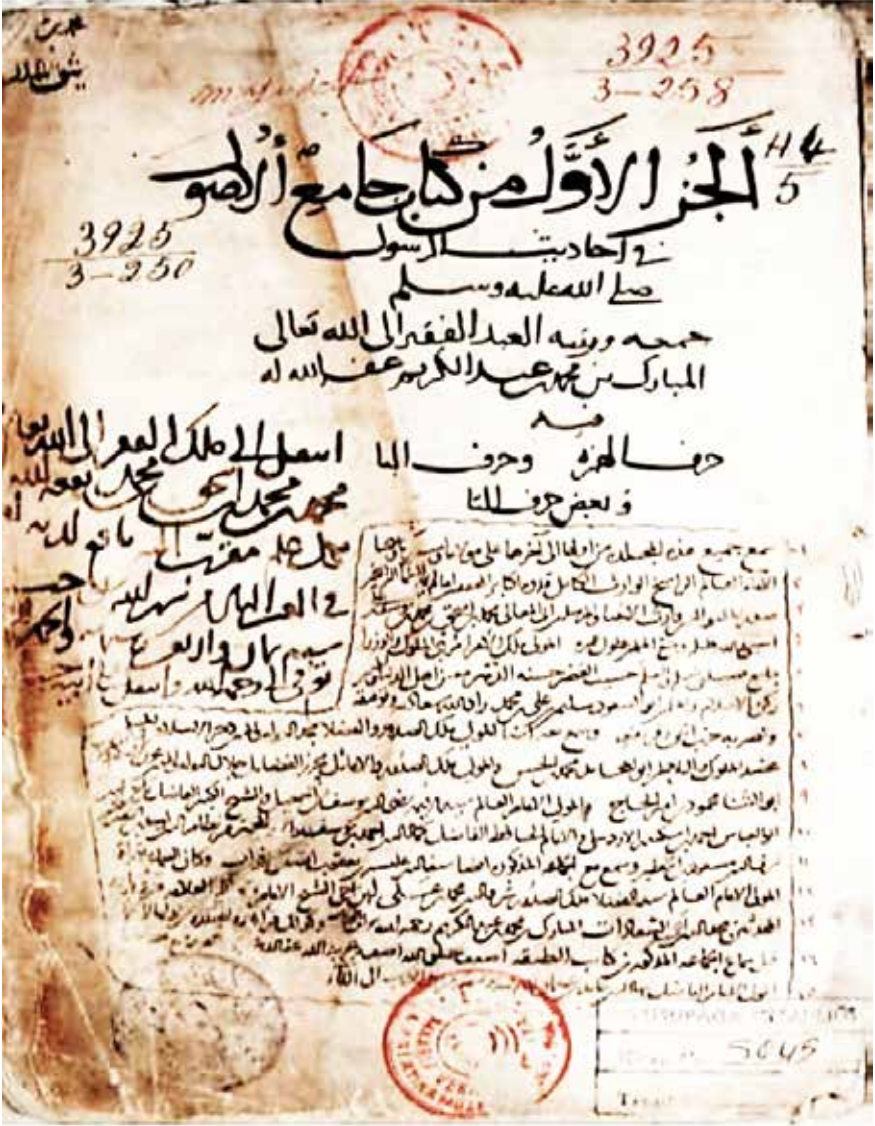
Sadreddin Konevi (sema kayıtları)

tu. Bunun üzerine sesli olarak duyacağı ilk ayete göre hareket edeceğini söyleyerek Kur'an-ı Kerim okunan bir yere gitti.