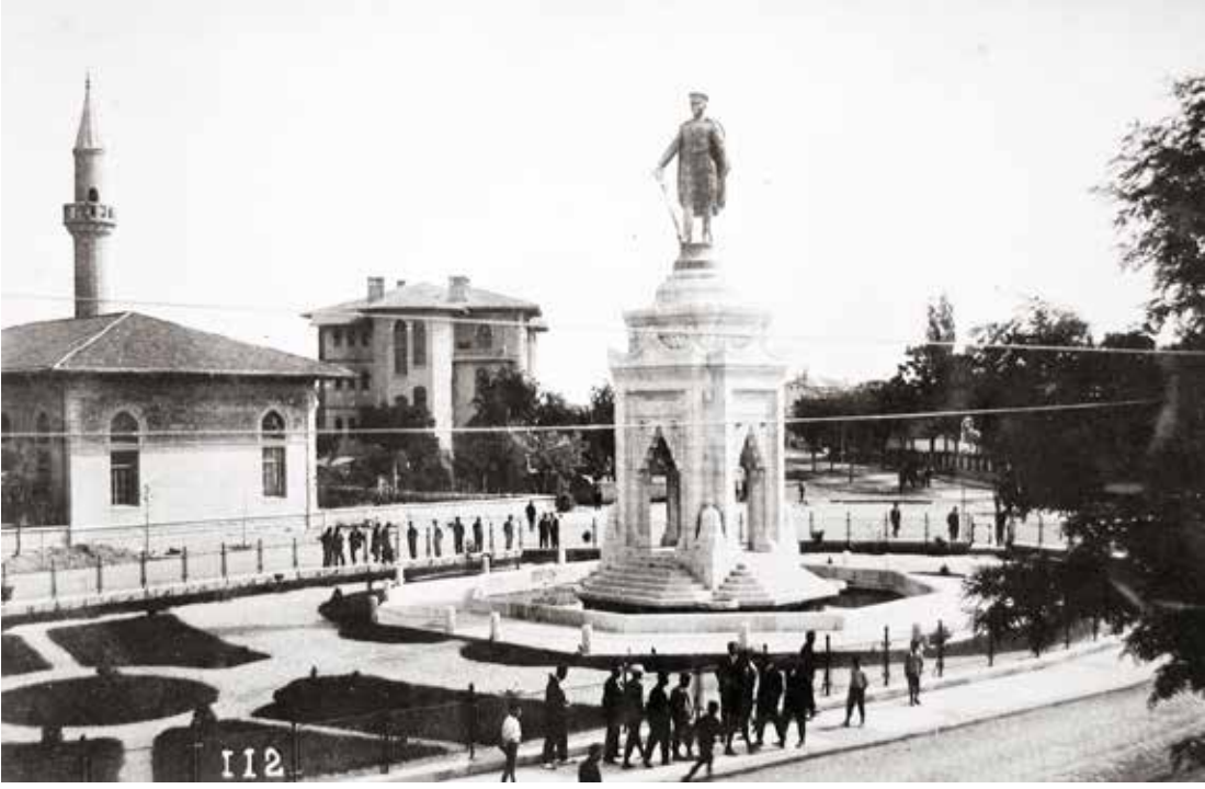
Amber Reis Camii, Konya Lisesi ve Atatürk Anıtı

tap yayımlandıktan sonra kitabın son kısmında bulunan 6 fotoğraftan oluşan Guillaume Berggren tarafından çekilen Konya panoraması ve 12 fotoğraftan oluşan İbrahim Nuri Tongur'un Konya panoraması bazı Konyalılar tarafından kesilerek çerçeveletilip duvarlara asılmıştır. O günün sınırlı imkânlarıyla şehir merkezinde bulunan yapıları olanca güzelliğiyle fotoğraflamak çok büyük bir başarıdır. Şehrin ortasında bulunan Alâeddin Tepesi ise çoğu Konya fotoğrafının çekilmesine imkân sağlayan bir mekândır. Çünkü çoğu şehir merkezinde o yıllarda böyle yükselti bulmak pek mümkün değildir.