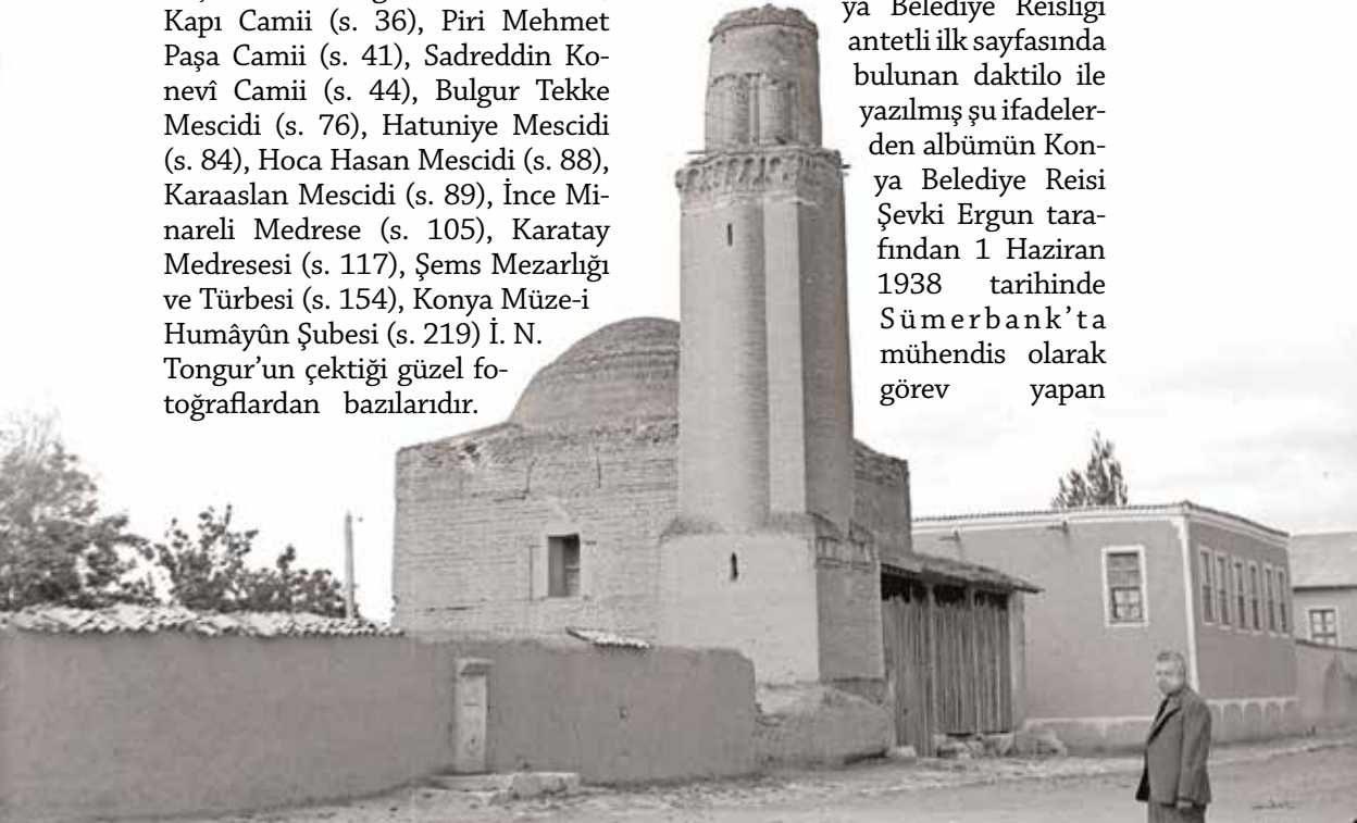
Hoca Hasan Camii