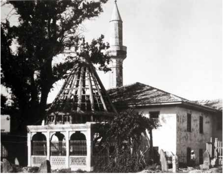
Sadreddin Konevi Camii ve Türbesi