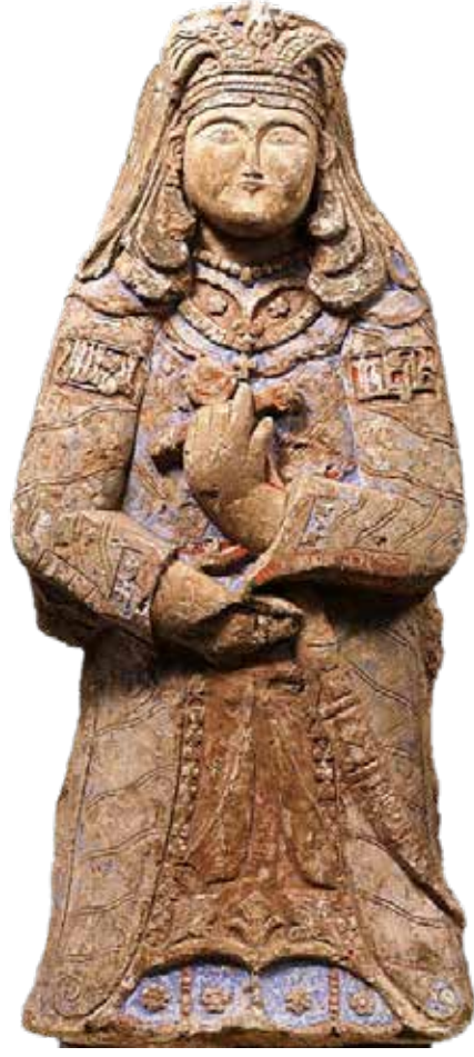
Selçuklu hanımı heykelleri.