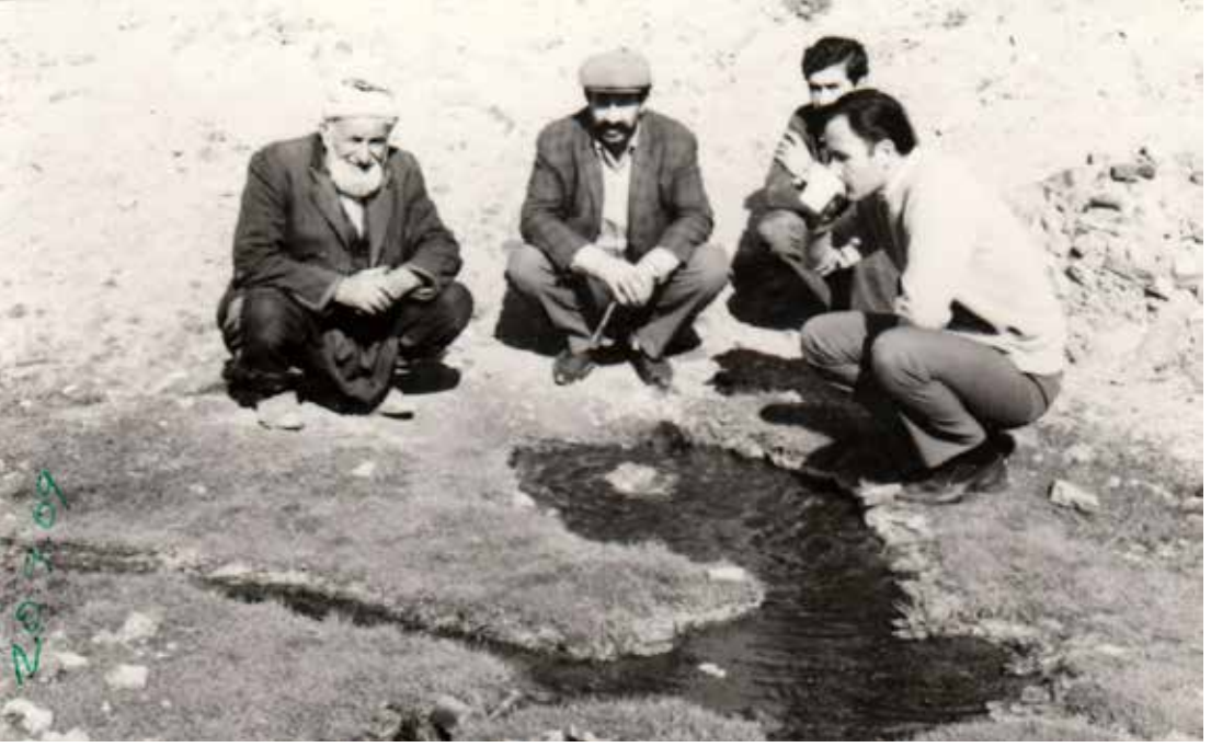
Şifalı suyun başında