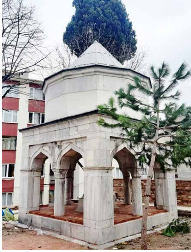
Devlet Şah Hatun, Bursa.

DEVLET HATUN: Tebrizli Emir Kayzer'in kızıdır. Hz. Mev-