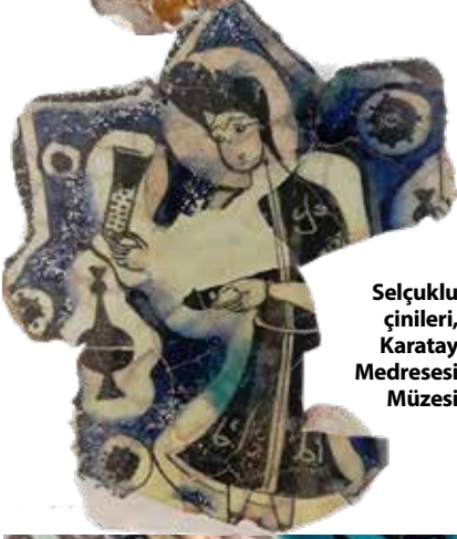
Selçuklu çinileri, Karatay Medresesi Müzesi