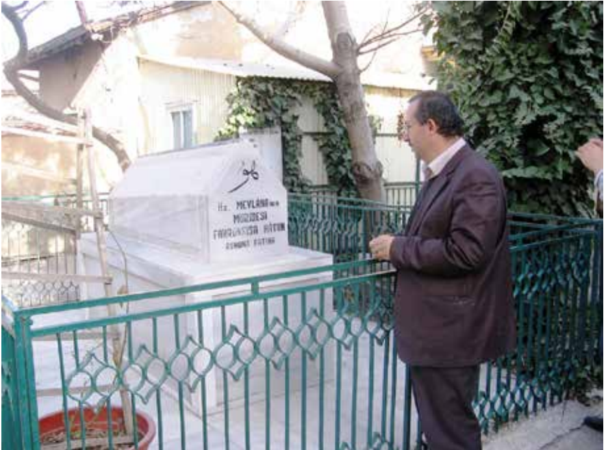
Fahrünnisa Hatun, Konya.

FAHRÜNİSA HATUN: Asıl adı Nizam'dır. Hz. Mevlana'nın en sadık müridelerindedir. Yaşadığı dönemde dinine düşkünlüğü ve faziletleri sebebiyle “yeryüzünde kadınlığın övücü” manasına gelen “Fahrünnisa” lakabıyla anıldı. Vefat ettiğinde Çaybaşı'nda adının verildiği Fahrünnisa Camii haziresine defnedildi.