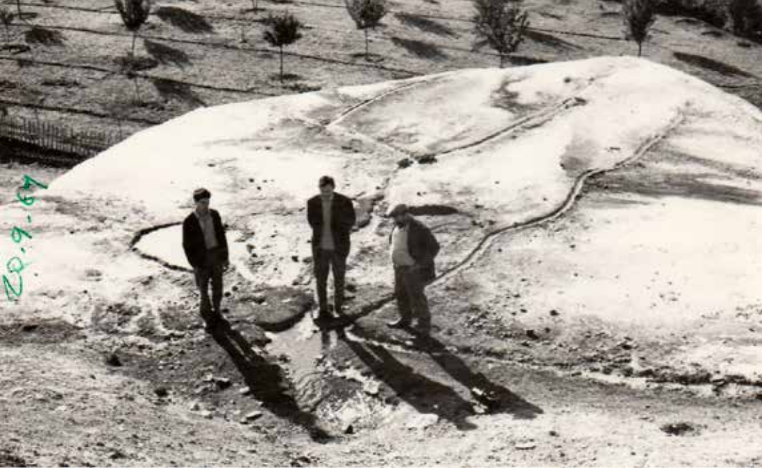
Şifalı suyun çevresi

yaret ettiğim Kürtün ve Köse de ilçe olmuşlardı.