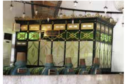
Mümine Hatun, Karaman.

MÜMİNE HATUN: Belh Şehri Emiri Rükneddin kızı Sultanü'l-ulema Bahaeddin Veled'in eşi, Hz. Mevlana'nın annesidir. Mümine Hatun, anne tarafından da soyu hanefi fakihlerinden Şemsüleimme Muhammed Serahsî ile birleşmektedir. Bahaeddin Veled ile evliliğinden Fatıma adında bir kızı ile Muhammed Celeddin ve Muhammed Alaeddin adında çocukları oldu.