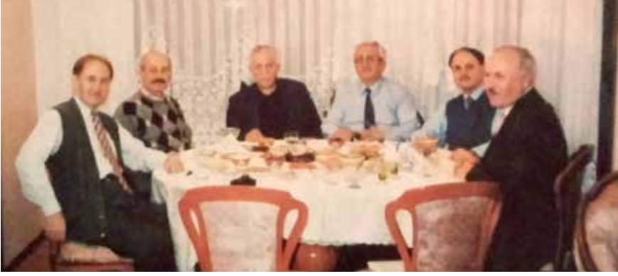
Bezmi-i Muhabbet, bizim ev: 2002 kışı.