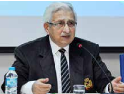
Merhum Hasan Özönder'in Necmettin Erbakan Üniversitesi Sanat Tarihi Konferansları kapsamında “Konya Kültürü ve Mevlevilik” Konuşması (2016)

Şahsımın öğrenciliğimde ve mesleki yolculuğumda bana kazandırdığı bilimsel disiplin, sabır ve mütevazılık, örnek aldığım hocamdan kalan mirastır. Sevgili Hocam H. Özönder'i bir kez daha bu sayfalarda özlemle ve sevgiyle anıyorum. İşte Konya kültürü ve Türk yükseköğretimine katkı sağlayan H. Özönder hocama Allah'tan rahmet diler, mekanı cennet olsun, inşallah, diyorum.