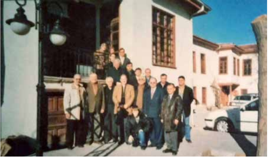
SÜ Selçuklu Araştırmaları Merkezi konferansı 2005 baharı