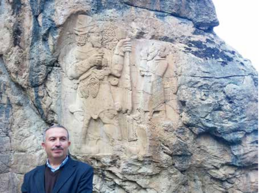
Ereğli İvriz'deki Kaya Anıtı

"Konya'nın eski abideleri" adlı bu bölüm 12 sayfadır. İlk bölümde Nuh Tufanından başlayarak, Konya'nın kısa bir tarihi verilmiştir. Yunan mitolojisinden kaynaklanan Konya isminin nereden geldiği anlatıldıktan sonra Hititlerden bahsedilmiş ve Ereğli İvriz'deki Kaya Anıtı'nın Hititlerce önemi üzerinde durulmuştur. Pers, Frig ve Roma dönemlerine işaret edildikten sonra Hristiyanlığın ilk dönemlerinde Pavlos'un Konya'ya gelerek Hristiyanlığı tebliğ ettiğinden bahsedilmiştir.