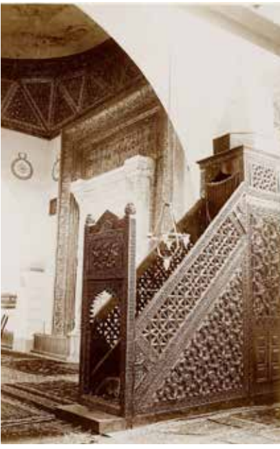
Alaeddin Cami minberi