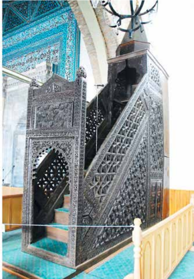
Alaeddin Cami minberi