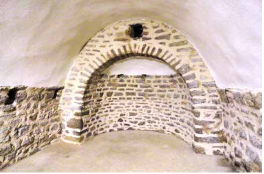
Ayasofya Klisesi Sırçalı yanı

ziyaret ettiği belirtilmiştir. Osmanlıların burayı Birinci Murat ve Yıldırım Bayezid döneminde geçici olarak ele geçirdiğini ve Fatih Sultan Mehmet'in 1466'de kesin olarak Osmanlı topraklarına dâhil ettiği anlatılmıştır.