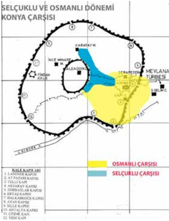
Konya Kalesi planı

nesi şehir-i Safer’inde (Safer/Nisan ayında) münhedim olan (yıkılan) çiniler ile müzeyyen (süslü) fevkani eyvanın Selçuklu saraylarından aksamından ve saray suru kulelerinden biri üzerine müstenit bulunmuş olduğu ağıleb-i ihtimaldendir (kuvvetle ihtimaldir).