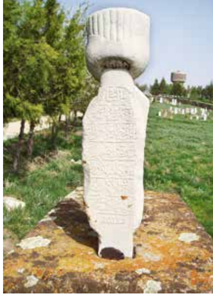
Koç Bekir Ağa'nın kabrinin baş taşı

Konya hadisesinin sonucu hususunda BOA'da rastladığımız bir belge, Dalboy ve Es gibi mahallî araştırmacılarının belirttiklerinin aksine Cevdet Paşa ve Uzunçarşılı'yı destekler mahiyettedir. 1 Safer 1219