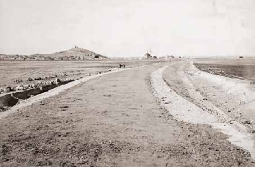
Karapınardan Ereğli'ye doğru, Karapınar kasabasının uzaktan görünüşü ve yolun yapımı

muhtaç olup Karaviran Gölü'nden açılacak kanallar ve uygun yerlere bentler inşa edilerek Beyşehir Gölü'nün suyunun Konya Ovası'na ölçülü bir şekilde akıtılması hem Karaviran Gölü arazisinde ziraat yapılmasını sağlayacak ve hem de Konya Ovası'nın geniş arazilerini uygun seviyede sulamaya yarayacaktır. Bu suretle o civardaki yerleşim alanları da kötü havadan kurtulmuş olacaktır. Konya Ovası'nda suyun akacağı kanallar olmadığından suyun birikmesine engel olmak için kanallar açılarak bu kanallardan suyun akması ve yeni tarım aletleri alınarak ve bu aletlerin kullanımını öğretmeleri için Almanya ve Belçika'dan bilgili kimseler getirilerek ovanın belirli yerlerine orman ağaçları ekim ve sulaması yapılmalı ve suyun Karapınar Ovası ve başka yerlere de götürülmesi yolları aranmalı ve böylece tarıma açılacak sulanabilir arazinin artması arazinin kıymeti ve öşrünün artmasını sağlayacak ve bundan dolayı da gerek hazine ve gerekse halkın gelirleri artacağı husus Şurâ-yı Devlet'e bildirilmiş ise de yapılması düşünülen bu iş epeyce masraf gerektirdiğinden öncelikle su mühendisi tarafından gerekli yerlerde keşif yaptırılacağı bildirilmiş ise de devlet ve halka bir çok faydası olacak bu işin erte-