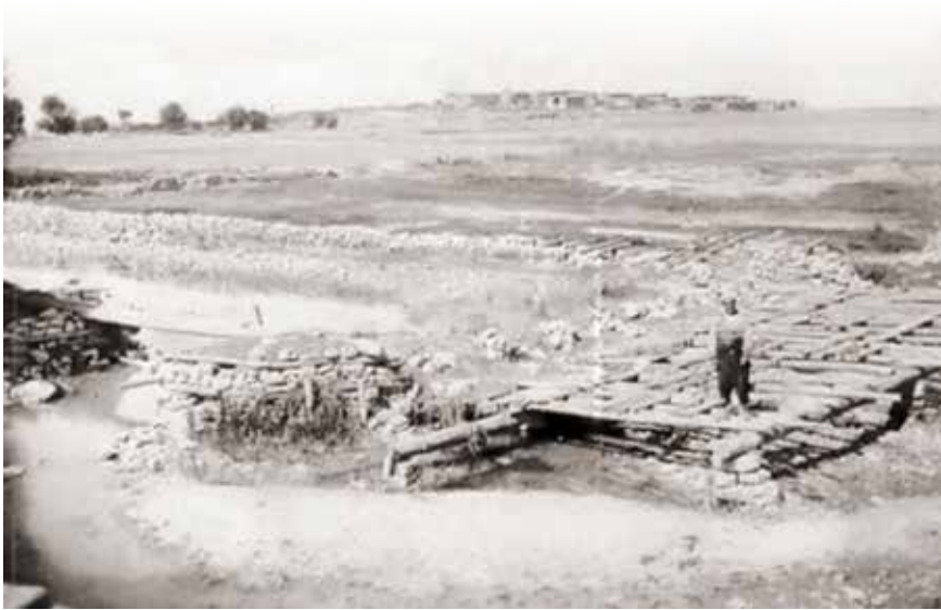
Beyşehir Köprüsü'nün inşaatının başladığı günlerde inşaat mahalli ve arka planda Eşrefoğlu Camii.

Bölgede üretilen ürünlerin diğer bölge ve limanlara sevkinin ve