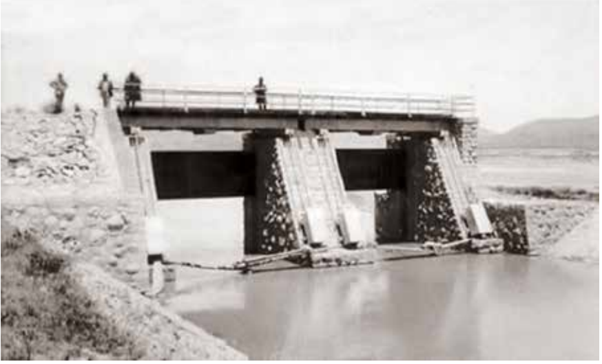
Beyşehir Çayı ile gelen suyu kontrol maksadıyla Beyşehir-Suğla arasında inşa edilmiş bağlama regülatörü, 1900'li yılların başı.

satışının temini için yolların yapılması talep edilmiş. Bu yollar: