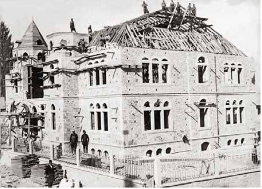
1898 yılında inşaatına başlanan ve 1901 yılında tamamlanan Konya Sanayi Mektebi

kezinde ilkokul öğrenimini kolaylaştıran Hurûfât Mektebi (Alfabe Okulu) yapılıp meşhur olan faydaları yönüyle bunun Konya'daki her ilçe ve köyüne yaygınlaştırılması ve Rüşdiye Mektebi olmayan yerlerde kanuna ve yönetmeliklere uygun olarak Rüşdiye Mektebi yapılmasının gerekliliği açıktır.