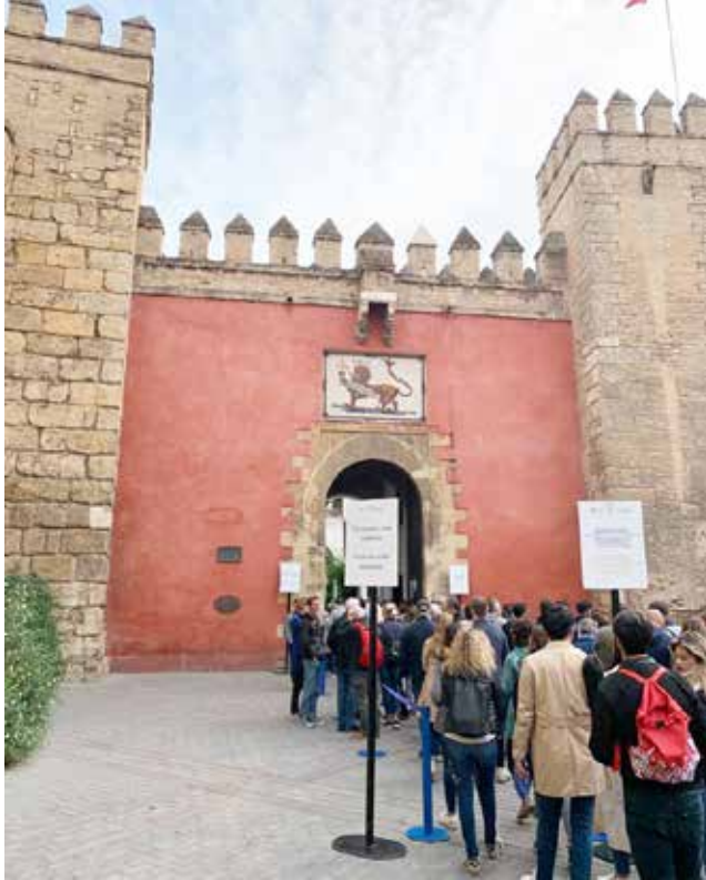
Alkazar Sarayı Girişi

Ardından da Tarık Bin Ziyad'ı oraya gönderen Musa Bin Nusayr daha büyük bir orduyla İspanya'ya geçerek fetih harekâtına katılır. Kısa bir süre içinde Endülüs'ün büyük bir kısmı ele geçirilir. Halk adalet ve merhametle muamele ederler. Halk şaşkınlığa düşer. Oranın ileri gelenlerinden biri, İslam Komutanına va-