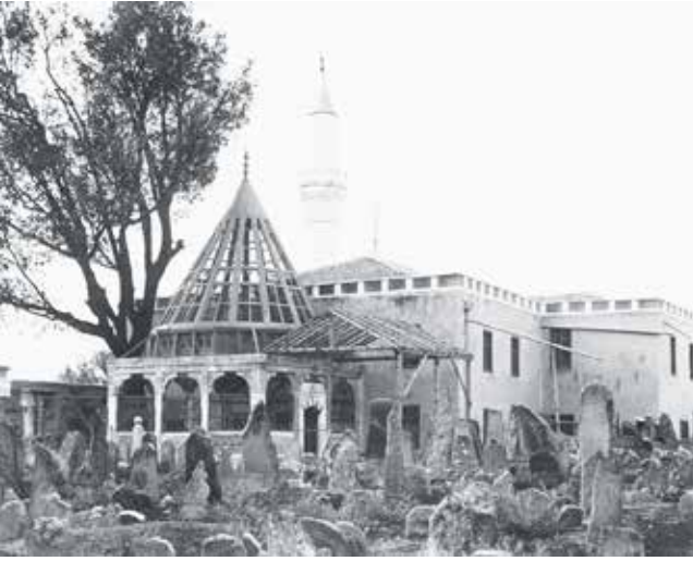
Sadrettin Konevi Türbesi.

İbnü'l-Arabî, rüyaya çok önem verir ve gördüğü rüyaları tevil eder.