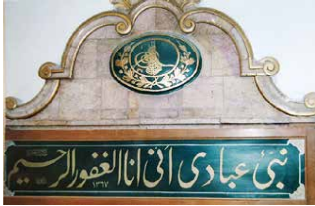
İbn-ül Arabî Türbesi girişi, üzerindeki II. Abdülhamid Han'a ait tuğra.

düğü yerlerde son kalışı oldu. Merakeş'te iken aldığı söylediği manevi bir işaretle Doğu'ya doğru yola çıktı. 1200 yılında Mekke'ye kadar gidip ilk haccını yaptı.