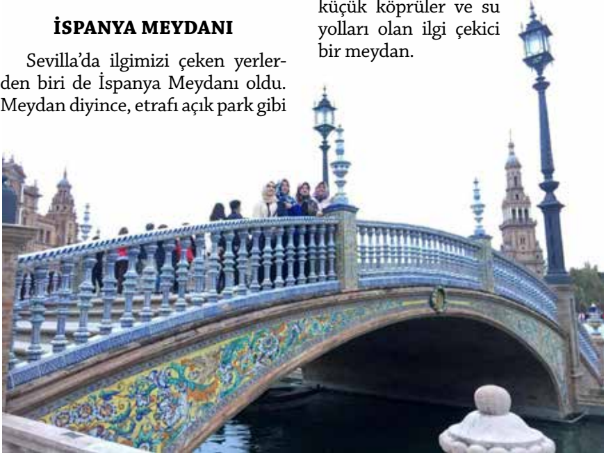
Sevilladaki İspanya meydanı

bir alan düşünmüştüm. Ama burası kale gibi, burç gibi yapılarla çevrilmiş, çok büyük, üstü açık akşamları kapısı kapatılan bir yer. Oldukça geniş, içinde havuzlar, küçük köprüler ve su yolları olan ilgi çekici bir meydan.