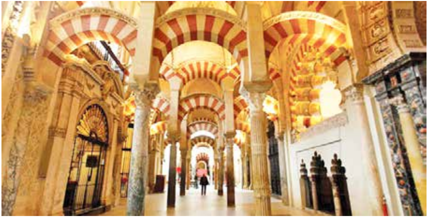
Kurtuba Camiinin içi