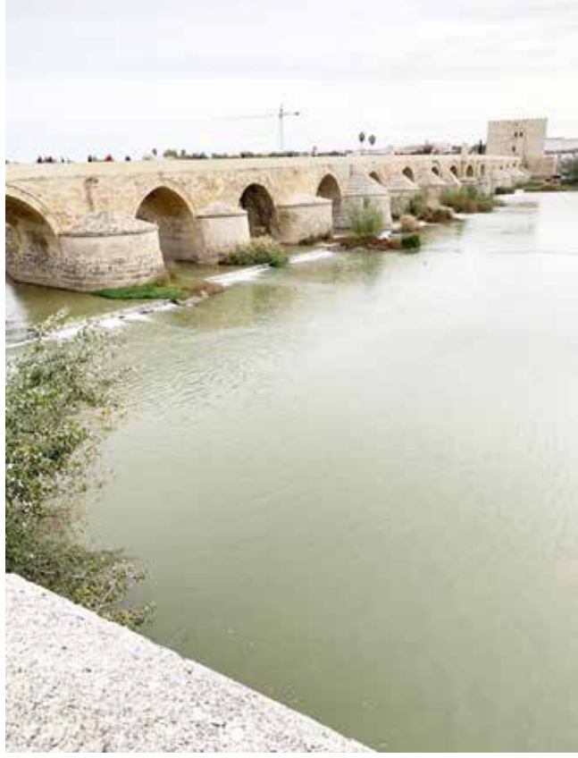
Kurtuba Kütüphanesindeki kitapların atıldığı Guadalquivir (Wadi al-Kebir, Büyük Nehir) Nehri

Geceyi Sevilla'da geçirdikten sonra, sabahleyin Kurtuba'ya doğru hareket ettik. Burada İslâm Mimari-si'nin en önemli eserlerinden biri olan Kurtuba Cami'ini gezdik. Yapımına 785 yılında başlanan, 987 yı-