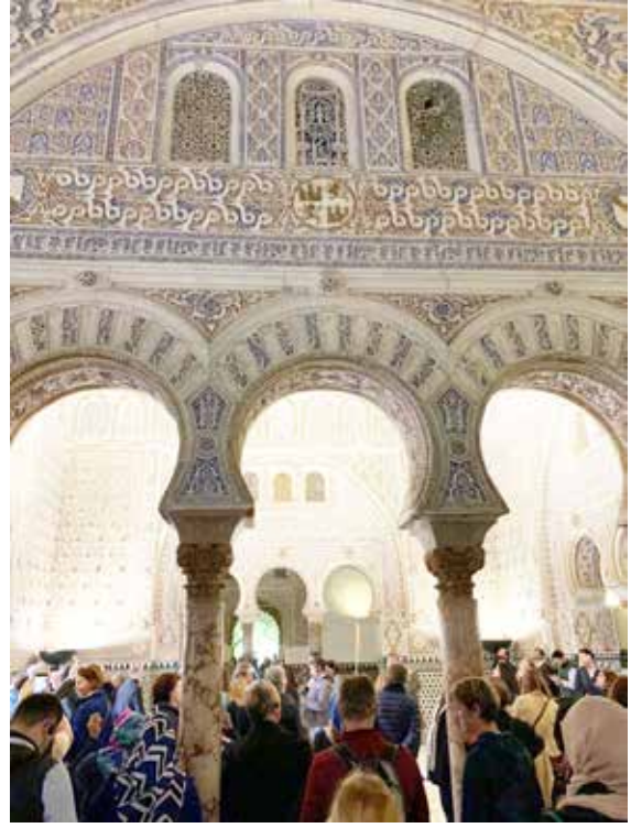
Alkazar Sarayı içi

Alkazar Sarayı'nın içini gezdik. Bahçesi de çok hoş bir şekilde düzenlenmiş. Bahçenin arka tarafında sarayın altına doğru bir giriş var. 10-15 metre ilerledikten sonra bir havuz çıktı karşımıza. Malum bu coğrafya çok sıcak, özellikle bahçede çalışan elemanlar çok terlediklerinde, koşarak geliyor ve havuza atlı-