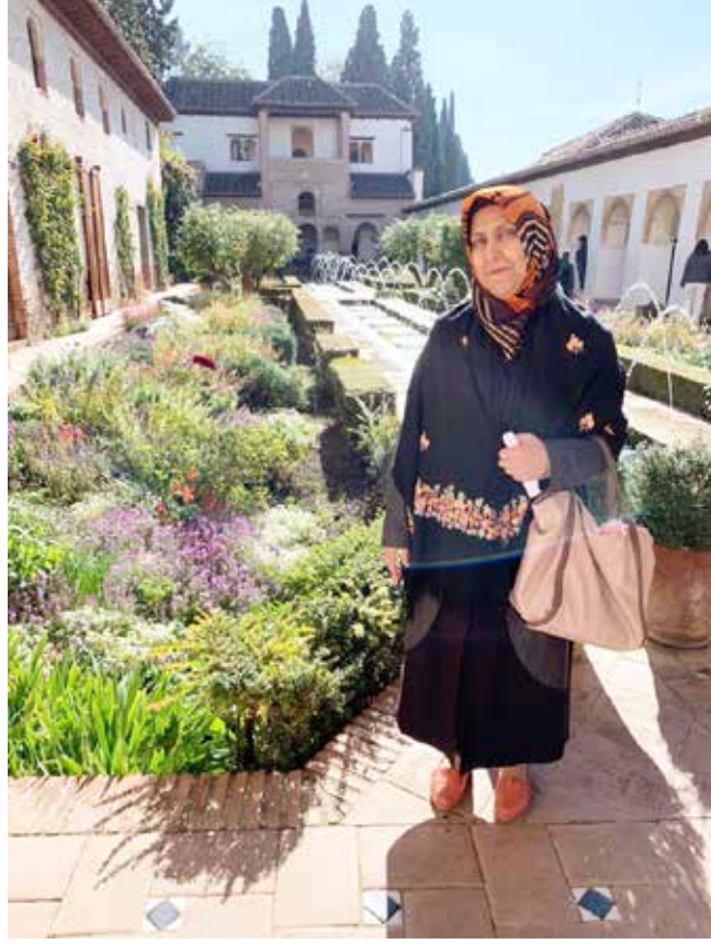
Al Hamra Sarayı bahçesi

Sonrasında caminin arka tarafındaki küçük iki katlı, o eski haliyle korunmuş ya da aslına uygun yeniden yapılmış, rengârenk çiçeklerle süslenmiş, çarşı olarak kullanılan dar sokakları gezdik. Biraz hediyelik alışveriş yaptık. Tur rehberimiz bizi, oradaki binalardan camiye çevrilmiş bir yere götürdü. Bu camiyi Cumhurbaşkanı Tayyip Erdoğan açmış. Önce bir Türk Hoca atanmış, ama yabancı dil bilmediği için uzun süre kalamamış. Daha sonra Faslı bir hoca göreve getirilmiş. Yan tarafta da imamın kafesi var. Böyle bir yaban elde camiye, tualete ve yemek yiyecek lokantalara ve kafelere büyük ihtiyaç var. O anda imamı bulamamıştık, biz de alternatif olarak sunulan, ortasında küçük bir bahçesi olan, çiçeklerle süslenmiş, sevimli, minik bir işletmede bir şeyler yiyip içtik. Buradaki ikramlarda bile Arap kültürünün yemeklerini bulabiliyorsunuz. Fas etkisi, tarzı yaklaşımı İspanya kültürüyle harmanlaşmış. Kısa bir süre sonra imam gelmiş, biz de namazımızı orada eda ettik. Sanki bu küçük mescit vatan toprağı gibiydi. Huzurlu, rahat ve sıcak... İhtiyaçlarımızı gidermiş olarak, Granada'ya doğru yola çıktık.