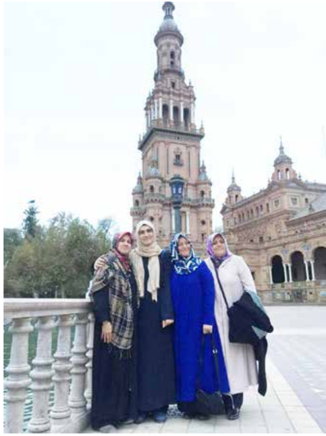
Sevilladaki İspanya meydanı

leri görünce içimiz sızladı. Orada yer adları bile hâlâ Arapça. Mesela az ileride akan Guadakibir Nehri; ki-bir yani Arapçada kebir, büyük nehir anlamında.