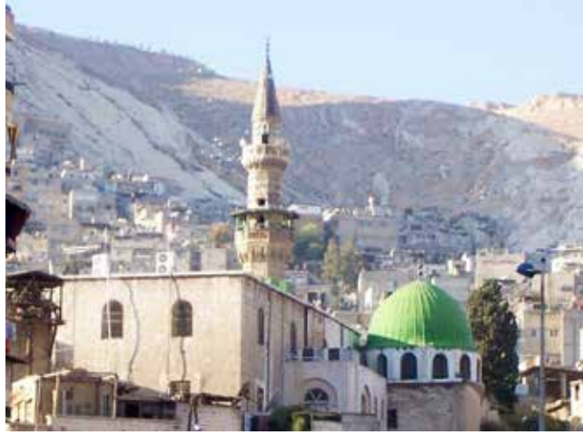
Şam'daki İbn-ül Arabî'nin Cami ve türbesi.

İbnü'l-Arabî, yirmi altı yaşlarında iken Tunus ve Fas'a gitti. O sırada Merakeş'te hocası ve babasının yakın dostu İbn-i Rüş'tün cenaze merasiminde hazır bulundu. 23-27 Haziran 1199'da Ramazan başında el-Mariyye'ye geldi ve burada "Mevâkiu'n-Nucûm" isimli eserini yazdı. Bu dönemde bazı meliklere kâtiplik yaptı. Bu onun doğup büyü-