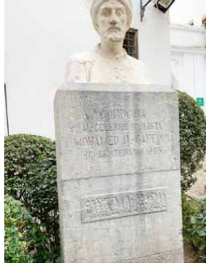
Göz hekimi Muhammed El Gafiki İspanyolcada gözlük kelimesi onun adından türemiştir