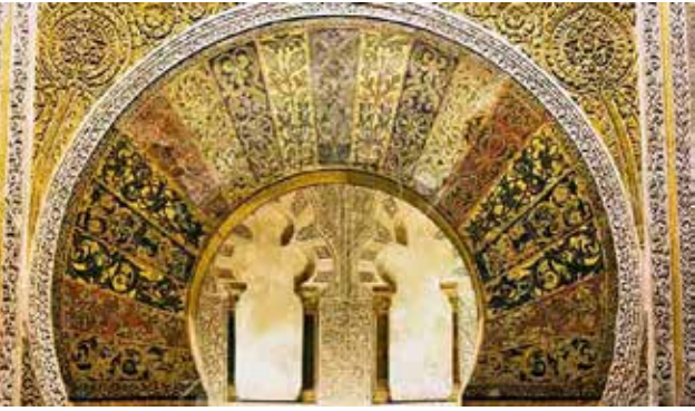
Kurtuba Camiinin mihrabı

Dışarıda, çan kulesine çevrilen minareyi görüp, yan taraftaki Kurtuba Kütüphanesi'nin yağmalanışını öğrenince insanın üzüntüsü çok daha fazla artıyor. Zamanın bütün ilimleri astronomi, mimarlık, matematik, tıp ve diğer alanlarda, dünyada en ileri seviyeye gelmiş, bilim adamları pek çok eser vermişler. Endülüs düştükten sonra, barbarlar bu kütüphaneyi yağmalamış, eşi bulunmaz nadide eserleri, hemen önünde bulunan nehre atmışlar. Nehir haftalarca simsiyah akmış.