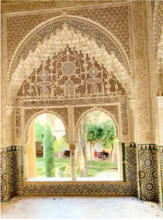
Al Hamra Sarayı

namıyormuş. Gruplara saray gezisi için randevu veriliyor. Belirli bir saatte doldurduktan sonra da dışarı çıkıyorlar.