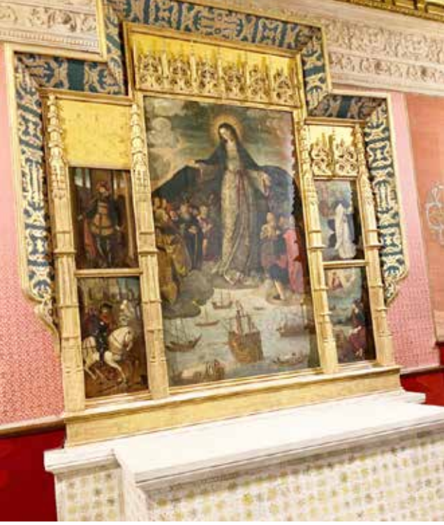
Alkazar Sarayında Kraliçe İzabella ile Marco Polo'nun görüştüğü salondaki temsili resim

tan'a ulaşabileceğini iddia ediyor. Diğer Avrupa ülke krallarıyla görüşüp, bunun için kendisine gemi ve asker temin etmelerini istiyor. Onlar kabul etmiyorlar.