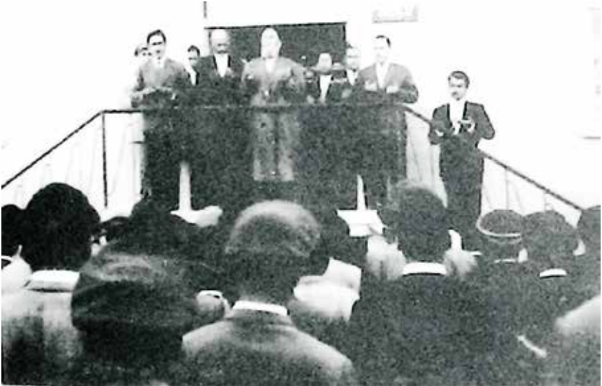
İmam Hatip Okulu'nun açılışında