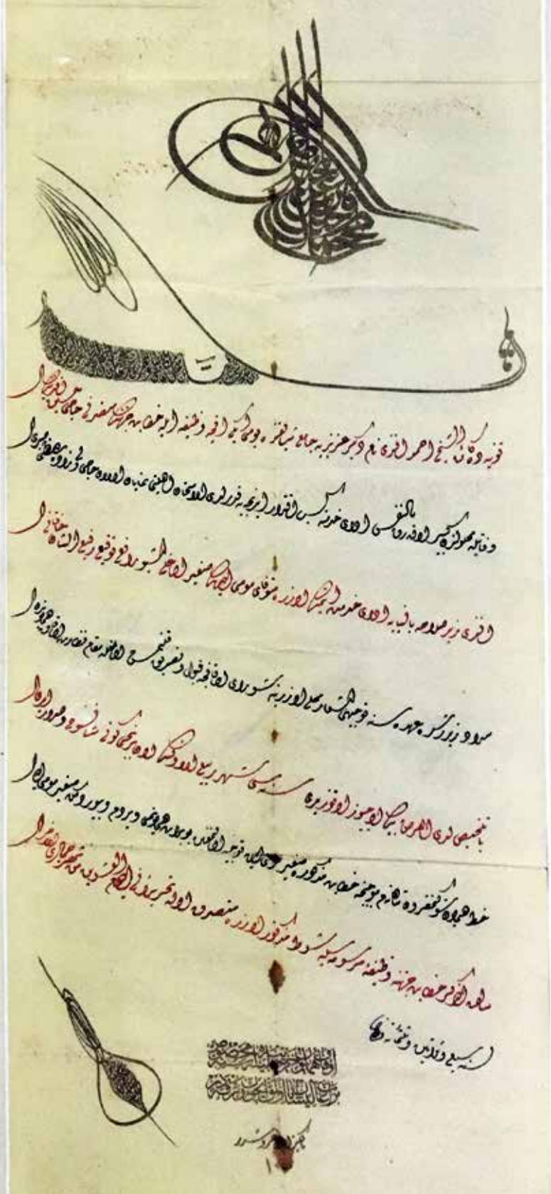
1337 H./1919 M. yılında Aziziye Camii için verilen Hatiplik Beratı