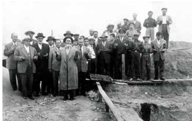
Bir temel atma töreninde