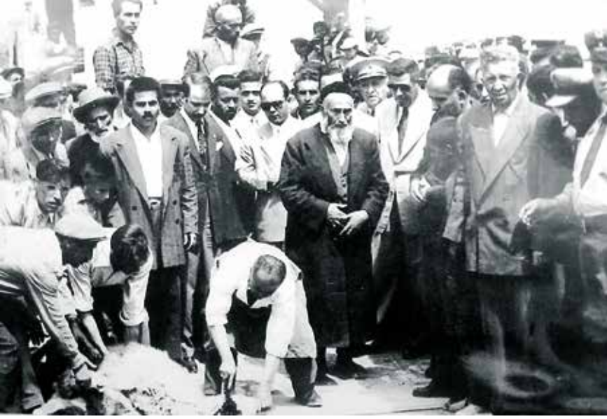
Bir temel atma merasiminde

sında Fatıha, Ayete'l-kürsi ve Ali İmran surelerinin 16-20 ayetlerini ve İhlas surelerini çokça okumalarını tembih ederdi. Öğrencilerine yüksek bir İslam ahlakı şuuru, ilim ve vazife aşkı, müspet düşünce ve topluluğa hizmet sevgisi telkin ederdi.