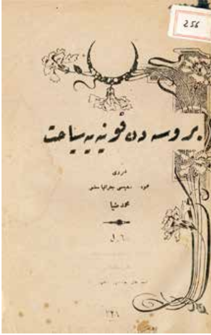
İHTİFALCİ MEHMET ZİYA BEY, Bursa'dan Konya'ya seyahat kitap kapağı, Osmanlı Türkçesi

layı gümüş liyakat almış ve dördüncü rütbeden Osmânî nişanı ile taltif edilmiştir. Sanayi Tarihi