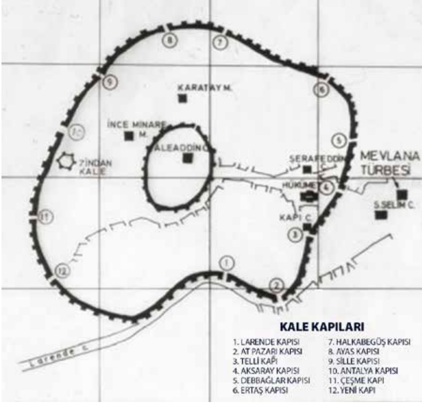
Konya Kale Kapıları