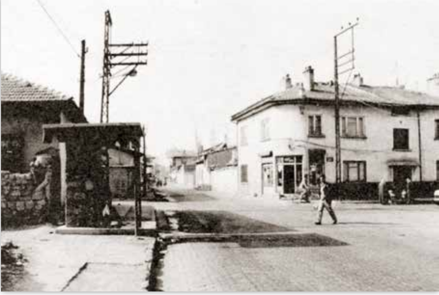
Karşı köşe ilk bakkalın yeri idi