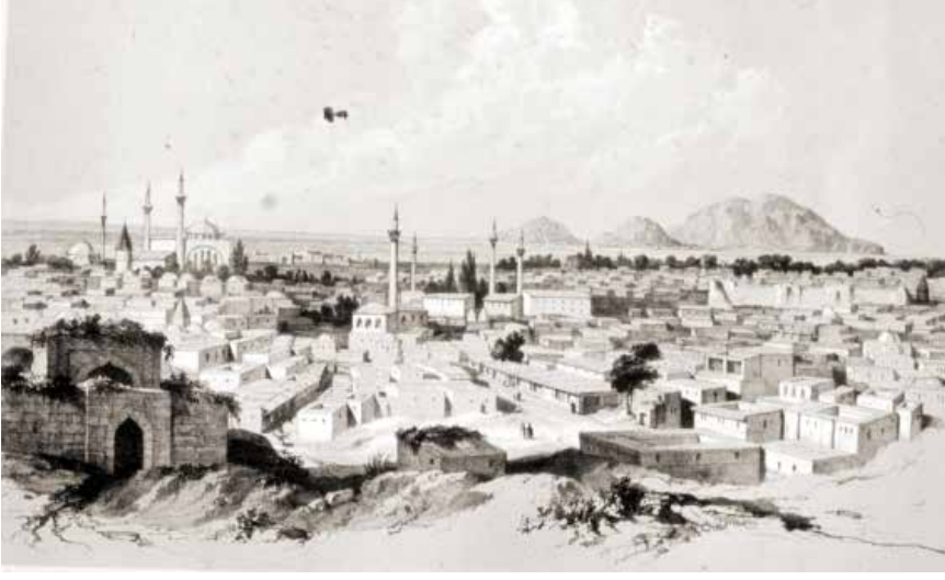
Matrakçı Nasuh'un Konya Minyatürü 16.yy.

mahalle, daracık sokaklar, mescit, çeşme gibi yapılar ve onların etrafındaki evlerden meydana geliyordu. Mahallelerde sokaklar küçük bir meydandaki çeşme ve mescide çıkıyordu. Bazı mahallelerde çıkmaz sokaklar vardı. Evler insan ölçülerine uygun, tek veya iki katlı ve sokaktan kerpiç duvarlarla ayrılmıştır.