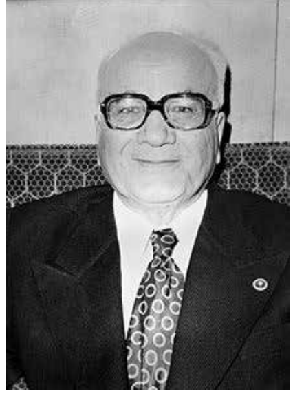
Prof. Dr. Sadi IRMAK (1904-1990)