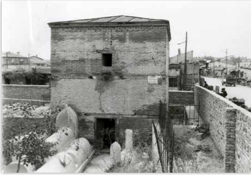
Pir Esad Türbesi ve Haziresi.

Ölübekledi Kabristanı: Ölübekledi Mahallesinde.