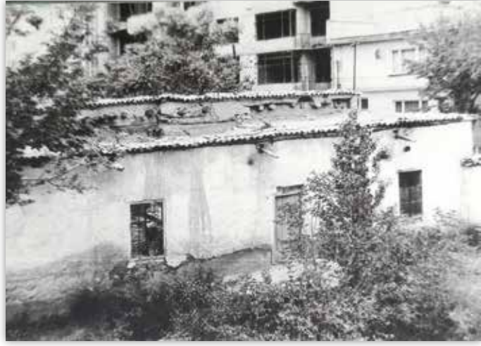
Restorasyon öncesi Ebu İshak Kazaruni Zaviyesi.

manlar bilad-ı İslamiyenin (İslam ülkelerinin) birçok yerlerinde -Ta- rikat-ı Mevleviye gibi- intişar et- miş (yayılmış) olan Kazaruniyye Tarikatı müntesiplerinin vücuda