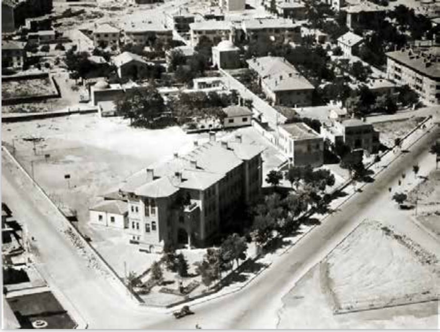
Konya Lisesi ve çevresi.

nünün öğleden sonrasında kültür edebiyat kolumuzun güzel bir etkinliğine tanıklık etmişim. Bu tür toplantılara bazen gönüllü olarak giderken bazen de arkadaşlarımızın hatırı için katılırdık. O günden kalan en önemli iz ne miydi? Alkış. Programın bir bölümünde daha önceden belirlenen öğrenci arkadaşlarımız birer fıkra anlatacaklar, biz dinleyiciler de o fıkraları alkışlayacağız. Hocamız Ertürk de saat tutacak, en çok alkışı alan arkadaşımız birinci olacak! Tabii burada alkış sadece fıkranın güzelliğine değil anlatanın arkadaşımız veya tanıdığımız birinin olmasıyla da ilgiliydi. Doğrusu kaç fıkra anlatıldı, kim kazandı hatırlayamıyorum ama bazı fıkralardan çok anlatıcılarını avuçlarımız patlayıncaya kadar saniyelerce alkışladığımızı unutamıyorum. Rahmetli hocamız daha sonra Ankara'ya geçmiş