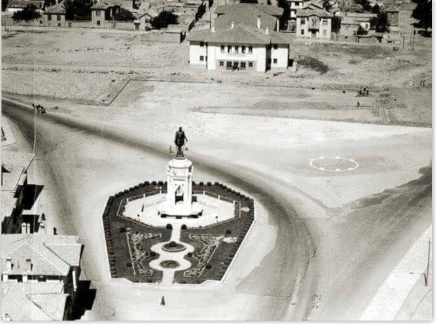
Atatürk Anıtı ve geri planda günümüzde Konya Devlet Tiyatrosu olarak kullanılan İl Halk Kitaplığı.

Ama bizim de kendimize göre sevincimizi belirten sözlerimiz olacaktı. En azından yarıda kalan bir maçın tamamlanması, çarşıdaki bir işimizin bitirilmesi gibi sebepleri sayabiliriz.