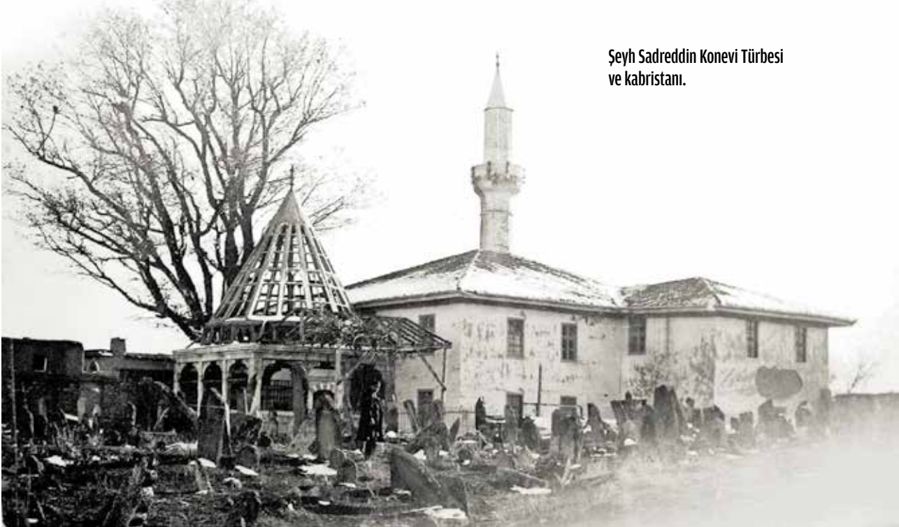
Şeyh Sadreddin Konevi Türbesi ve kabristanı.