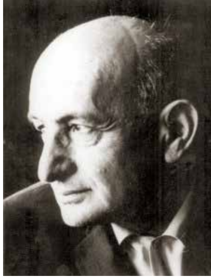
Nihad Sami Banarlı (1907-1974)