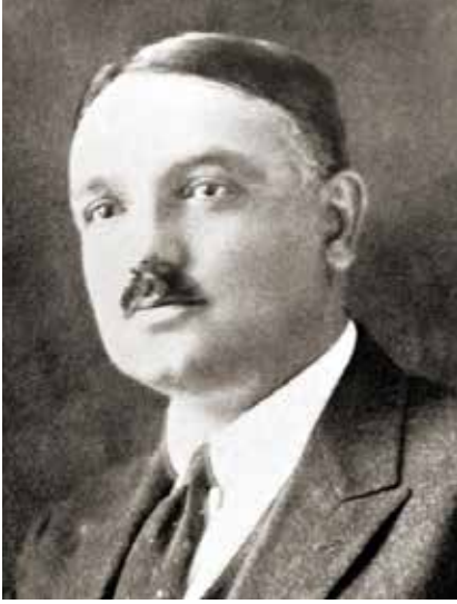
Yahya Kemal Beyatlı (1884-1958)

ğunun koristi (!) olarak seçmesin mi? Belli günlerde provalar yapıyor, ha bire çalışıyor. Gecemiz geldi, çattı. Sekiz on kadar türkümüz var da bir tanesini ilgi çekici bulduğum için anacağım;