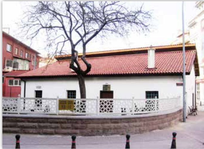
Ebu İshak Kazaruni Zaviyesi'nin günümüzdeki hali.