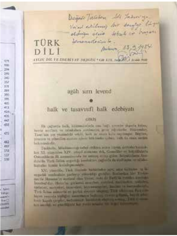
Türk Dili dergisi, Halk Edebiyatı Özel Sayısı'nın iç kapağı