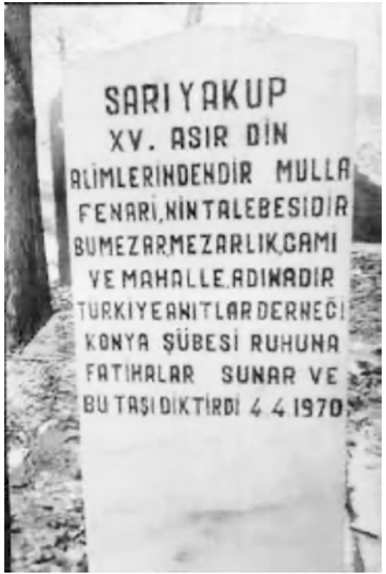
Sarıyakup'un yeni mezar taşı

Açıldığı günlerde Garaj olarak adlandırılan, günümüzde ise, özellikle dolmuş hatlarının adları belirlenirken Eski Garaj diye bilinen bölgede biraz dinlenelim ve Büyük Kumköprü Caddesi 'nin solunda kalan Sarıyakup Caddesi 'nden ötelere gele-