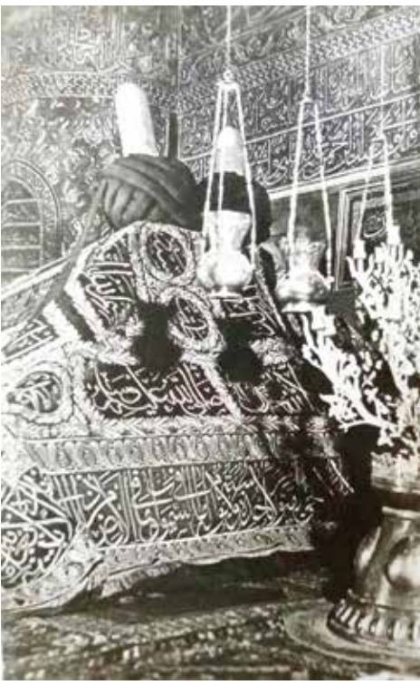
Ekrem Karayel'in, Hz. Mevlâna türbesinden bir kartpostalı