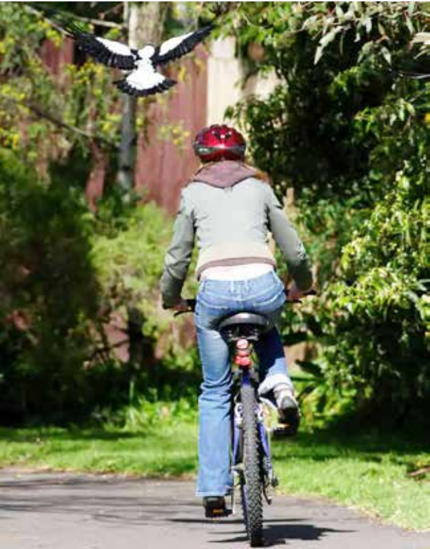
Avustralya saksağanı bir bisikletliye saldırıyor