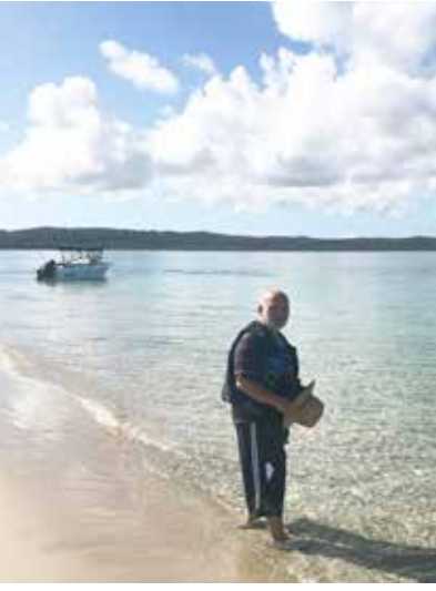
Kum adasından ayrılırken