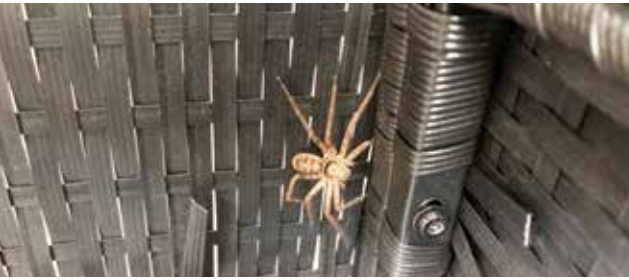
Bahçe sandalyesinin altına gizlenmiş iri bir örümcek