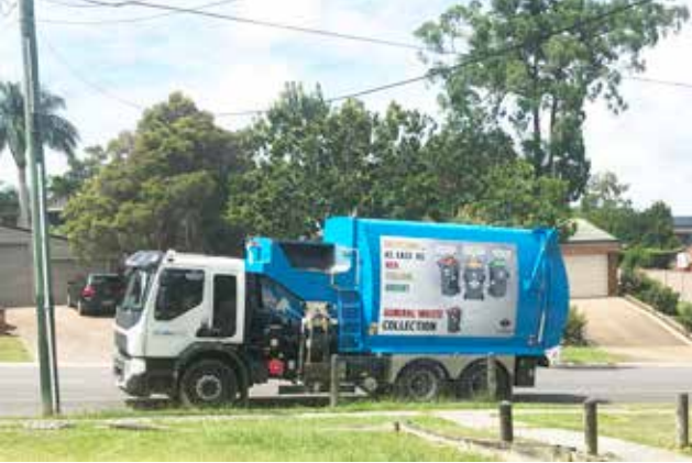
Çöp kamyonu çöpü alırken

çıkarılıp kaldırım kenarına bırakılıyor. Görevli olarak sadece şoförünün bulunduğu çöp kamyonu saatinde gelip yan tarafındaki robotumsu bir aparatla çöp kovasını güzelce kaldırıp içini kamyonu döktükten sonra kaldırımı bırakıyor. Bu işlem saniyeler içerisinde gerçekleşiyor.