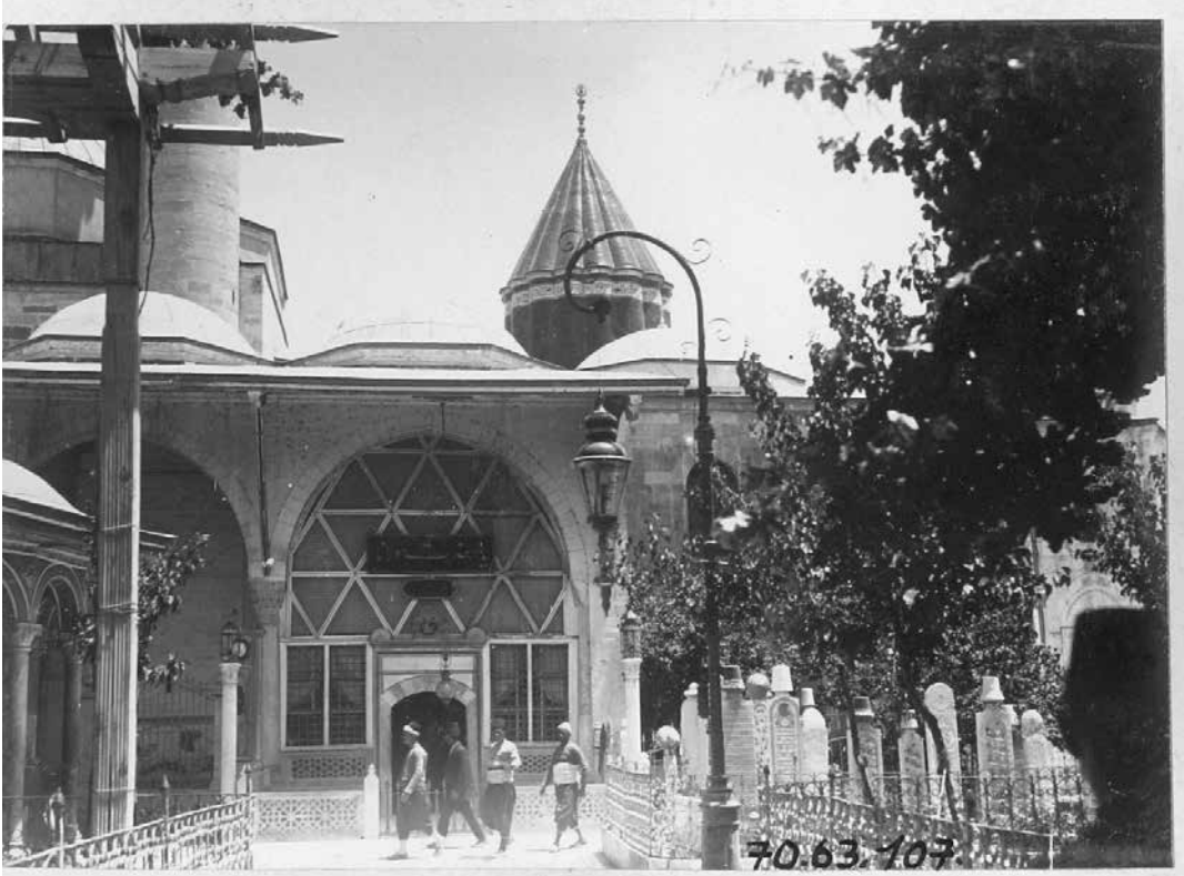
81, Konya, III. 20. - Mevlevî Dîşami /: dervis kotoslor :/

Bu büyük eserler inşa edilirken Selçuk Sultanlığı çoktan inhitat devrine girmişti. Moğol istilası birliği bozmuştu. Danişmenler, Karamanoğulları ve nihayet Osmanoğulları gibi aileler meydana geldi. Anadolu'nun bu büyük şehri Konya uzun müddet eski ehemmiyetini kaybetti. Grek'lerin Myrioketton dedikleri Sultan Dağları geçitlerinde mahvolan büyük Bizans ordusunun bakiyesini toplayan Manuel Komnenos zamanında, yahut bahçe duvarlarını aşarak Konya'nın dış mahallelerine giren ve Kilikya Nehri'ni geçerken boğulan Alman İmparatoru Frederik Barbarosa devirlerinde olduğu gibi Konya istila hedefi ol-