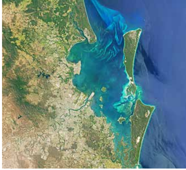
Moreton Körfezi'nin uydu görüntüsü

Kum adacığındaki on-on beş dakikalık molamızdan sonra oğ-