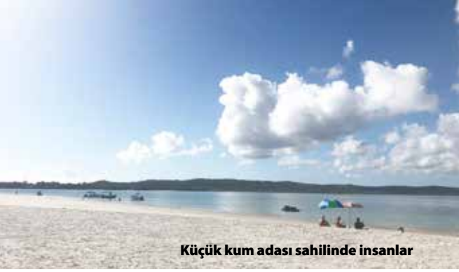
Küçük kum adası sahilinde insanlar

ren başlayan ağaçlıkların arasındaki basamak vari odun döşeli bir açıklıkta kısa bir yolculuktan sonra restoran görünüyor. Burası sadece bir bölümünün üstü örtülmüş, derme çatma tam bir balıkçı restoranı. Çardağın altındaki gölgelikli alanda bir masa beğenip oturuyoruz. Dip taraftaki barın bankosunun ardındaki iki genç adamdan başka bir görevli görünmüyor. Oğlum buraya varıp siparişimizi veriyor. Kısa bir bekleyişten sonra karton kutu içinde siparişlerimiz geliyor. Kemiği alınıp tam kıvamında kızarmış oldukça lezzetli balığın yanında bolca da patates kızartması. Buradaki lokantalarda ekmek servisi yok. Varsa yoksa “cips” dedikleri kızartılmış çubuk patatesler. Memlekette hiç fast-fooda gitmediğimden bu tarz cipsi hayatımda ilk kez burada yiyorum. Laf aramızda damağım bayağı da hoşlanıyor.