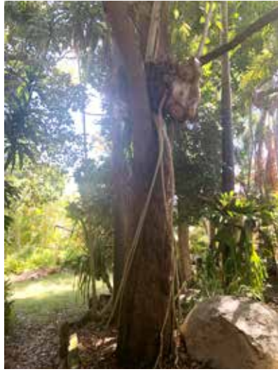
Balık yemek için çıktığımız adada bizi karşılayan enteresan bir ağaç