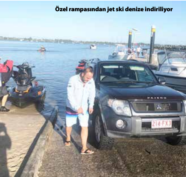
Özel rampasından jet ski denize indiriliyor

Sağ tarafımızda üzeri ormanlık bir adaya paralel ilerliyoruz. Kıyısındaki yerleşim yerleri ve