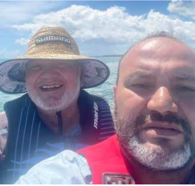
Dönüş yolunda oğlumla