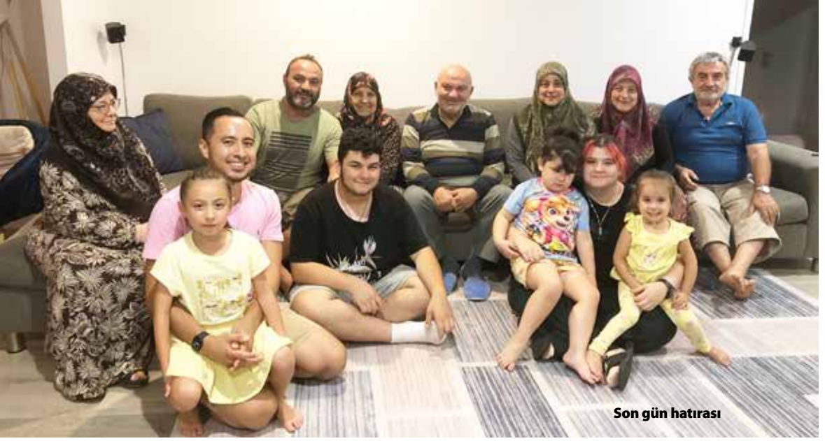
Son gün hatırası