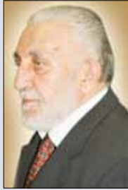
M. Ali UZ

Bu durumda, Konya Barosu'nun hangi yılda kurulduğu hususunda nasıl bir tarih kabul edilecektir? Bahsi geçen yıllarda Konya'da Hukuk