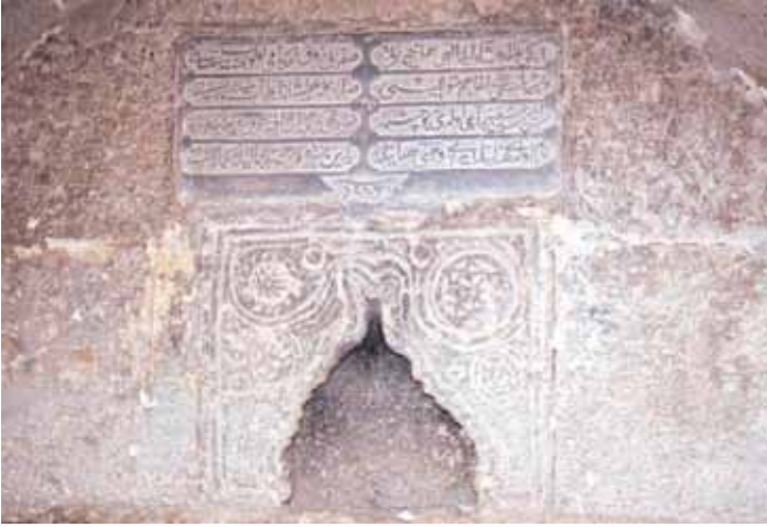
Yeşildere Çeşmesi Kitabesi (Haşim Karpuz)

hizasından yatay olarak profilli bir silme, çeşme cephesini ikiye böler. Aynalık üzerinden kaş kemerli bir taşlık bulunmakta ve kemer alınlığında rozetler yer almaktadır. Bunun üzerinde dört satırlık kitabe yer almaktadır. Yüzeysel silmelerle belirlenmiş dikdörtgen cephenin üzerinde üçgen alınlık gelmektedir. Çeşmenin talik hatla hakkedilen aşağıdaki kitabesini de bilinen Vehbî'nin kaleme alması mümkün görünmektedir.