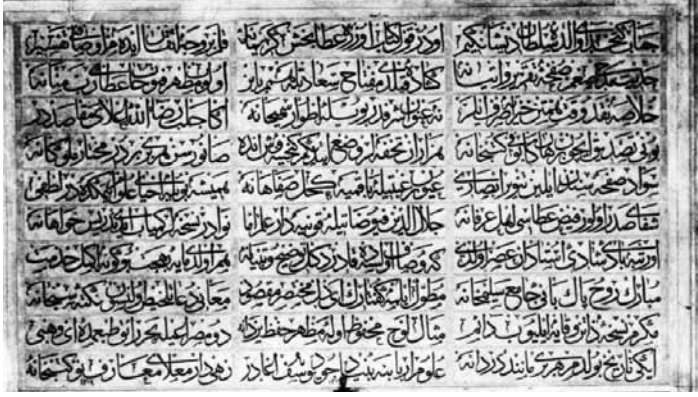
Yusufağa 2. kitabe (Haşim Karpuz)

lu bir kubbe ile örtülmüştür. Altı üstlü yirmi iki penceresi vardır. İçinin uzunluğu ve genişliği 10,80 metredir. Kütüphane tek katlı olup kubbeye örtülü bir salonu bulunmaktadır. Toplam kullanım alanı 110 m 2 'dir. Konya Bölge Yazma Eserler Kütüphanesi Müdürlüğüne bağlı olarak hizmet vermektedir.