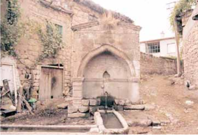
Yeşildere Çeşmesi (Haşim Karpuz)