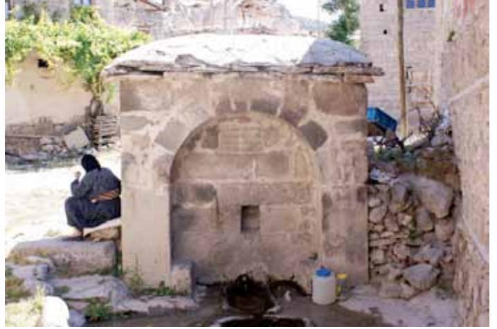
Beşşehir Karahisar Çamurcu Çeşmesi