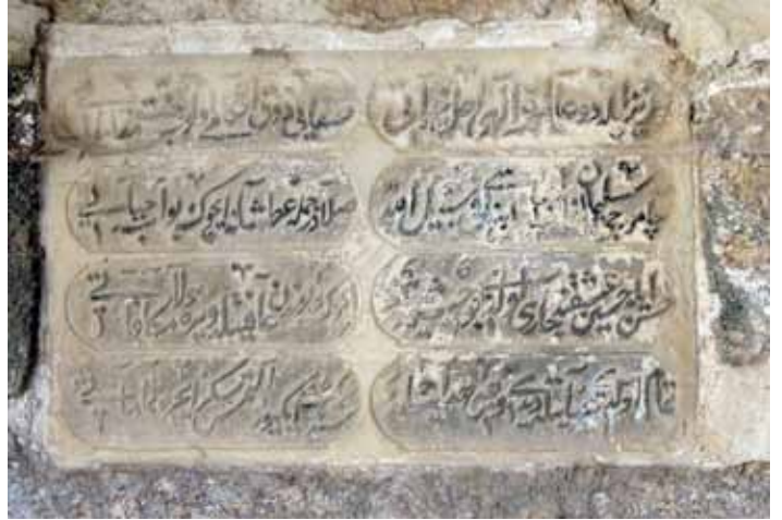
Beşşehir Karahisar Çamurcu Çeşmesi Kitabesi (Haşim Karpuz)

hidâyetle / Sene bin iki yüz altmış se- kiz içre tamâmâtı