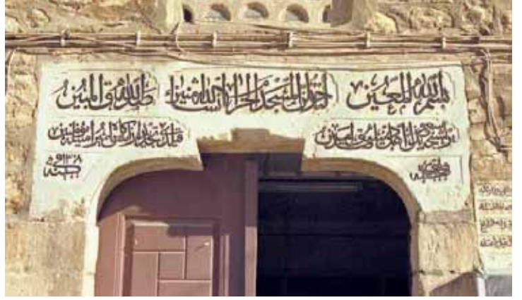
Ereğli Ulu Cami tamir kitabesi