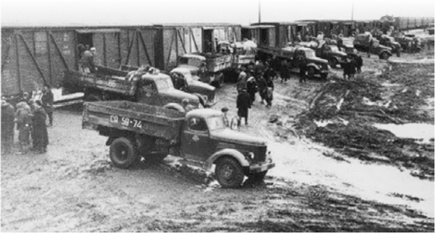
Vagonlardan indirilen Türkler kamyonlarla köylere dağıtılıyordu.

Türklerinin seslerini duyamadığımız gibi. Ara sıra çeşitli vesilelerle dünya Türklüğünü dile getirmekte, ekrana taşımakta, yaşadıkları topraklara ve şehirlere geziler düzenlemekte ve sohbetlere konu yapmakta sayısız faydalar var. Bu faydaları o insanları tanıdığınız ve dinlediğiniz zaman daha iyi anlayacağız.