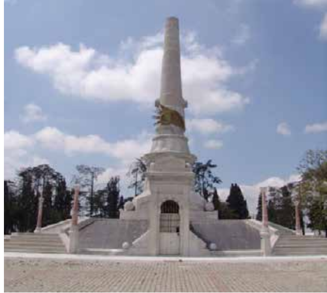
İstanbul Abide-i Hürriyet Anıtı.