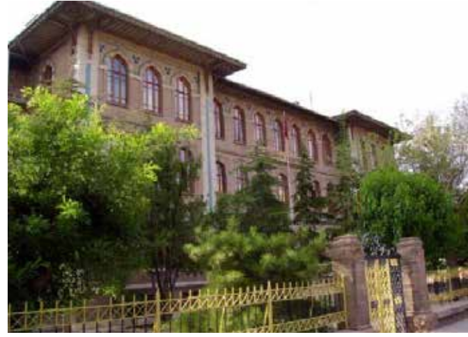
Konya Lisesi; Darülmüallimin (Erkek Öğretmen Okulu)