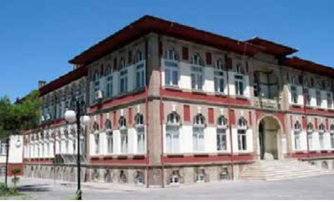
Selçuk Üniversitesi Rektörlüğü; Darülmüallimat (Kız Öğretmen Okulu)