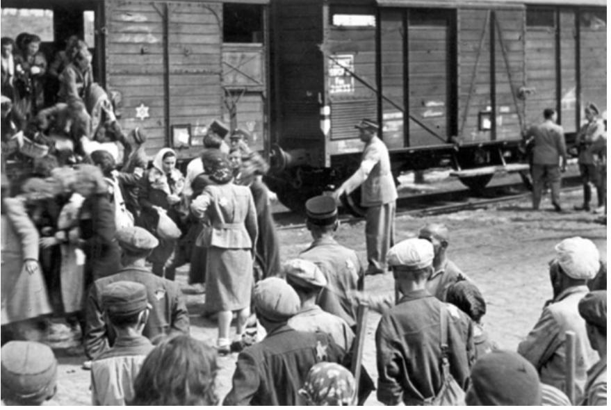
1944 Sürgünü Ve Sovyet Dönemi Kırım Türkleri

kimsesiz öldüler. Öyle bir serüven ki Allah kimseye yaşatmasın ve kimselerin başına böyle bir felaket vermesin.