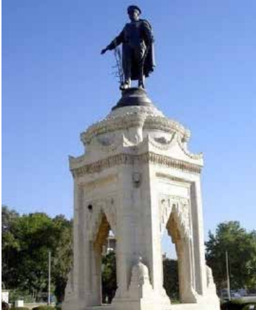
Konya Atatürk Anıtı; Ziraat Abidesi

maya başladı. Muzaffer Bey, aynı zamanda Mimar Vedat Tek'in İstanbul'daki en Önemli yapılarından Sirkeci Büyük Postahane, arkasındaki Hoca Hubyar Mescidi, Sultanahmet'deki Tapu ve Kadastro binalarının yapımında büyük emeği geçmiş, yapıların oluşması ve tamamlanmasında yararı dokunmuştur (3) .