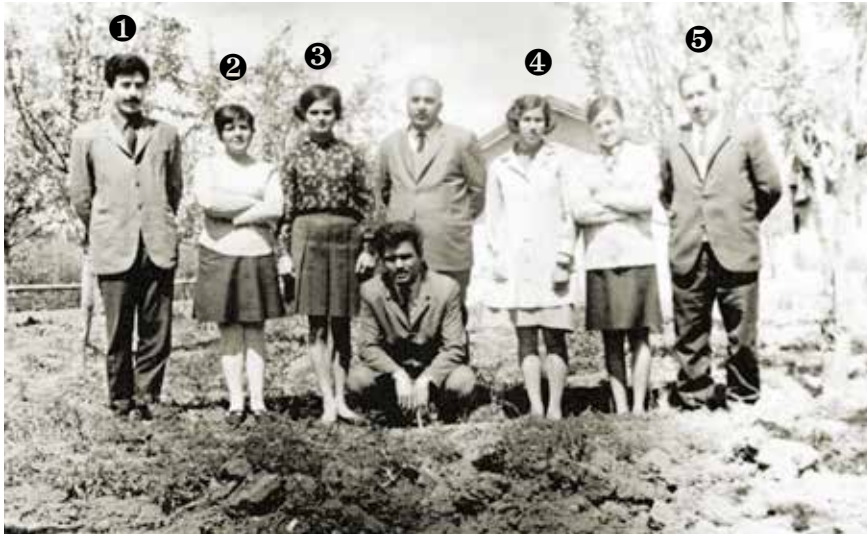
1968 yılı Karasınır ilkokulu Öğretmenleri: