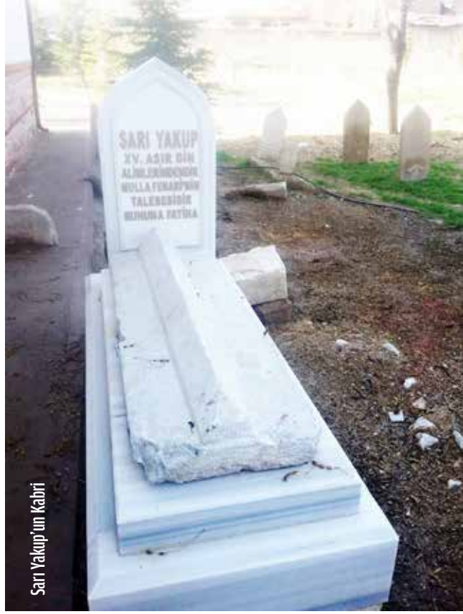
Sarı Yakup'un Kabri

Sarı Yakup, uzun süre Konya’da çeşitli medreselerde müderrislik yaptı ve kitaplar yazdı. Fıkıh, kelim ve hadis ilminde zamanının büyük âlimlerindendi. Şakaik-i Nümaniye’de “muhakkik (araştırmacı), müdakkik ve