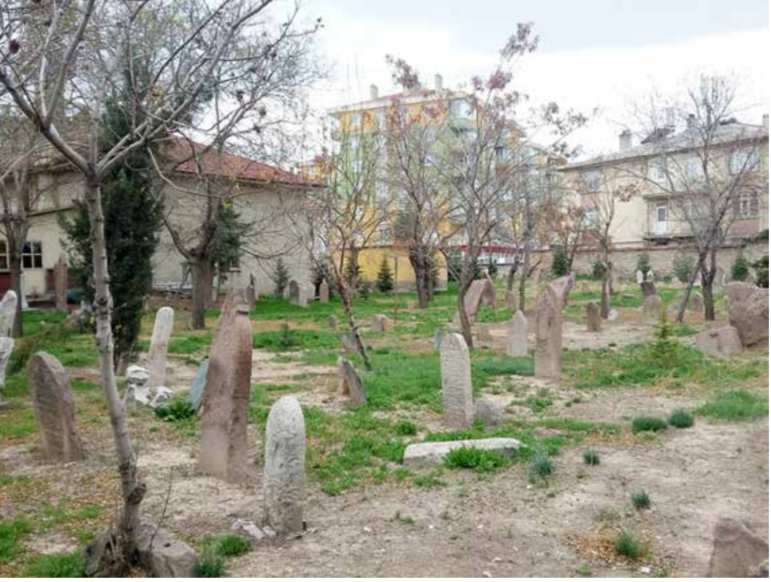
Sarı Yakup Mezarlığı