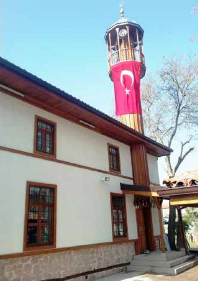
Sarı Yakup Camii.

suru rusulena” (6) ve “Ve yaktülüne’n-nebiyyine bi-gayrı hakkın” (7) ayeti kerimelerinin arasında, zahirde görülen tenakuzu geniş bir şekilde izah etti.