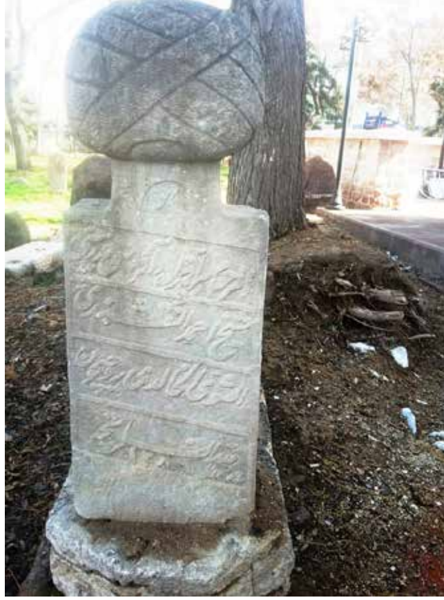
Saraczade Medresesi Müderrisi Şeyh Ahmet en-Nakşibendi, el Halîdî, v. 1286/1889.

mezar taşları bulunmayan Selçuklu, Karamanoğlu ve Osmanlı döneminde yaşamış bazı önemli alim, sufi ve hattatlar ise şunlardır: