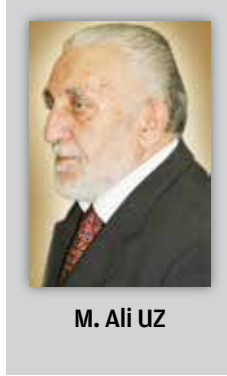
M. Ali UZ

Tek taştan şadırvan, Bekir Sami Paşa Medresesi'nin (Islah-ı Me-