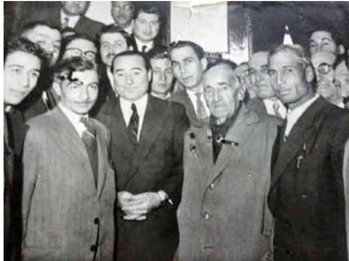
Adnan Menderes ve Abdil Büyükkılıç