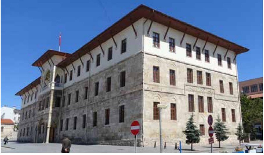
Sivas Valilik Binası

Üstteki büyük çini kabartma kitabe; “Biz geniş saraylardan dar kabirlere çıkarıldık. Malım mülküm bana fayda vermedi, saltanatım mahvoldu. Fani dünyadan ahrete yolculuk günü 617 şevvalin dördü” anlamına gelen bir yazı kuşağı yer almaktadır. Süslemede geometrik geçmeler, yıldızlar, kufi yazılar, mavi, lacivert, firuze ve beyaz renkleri ile şifa hanenin en önemli bölümünü oluşturmaktadır.