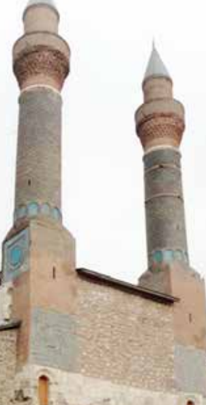
Çifte Minareli Medrese

ten sonra Sultan Alaeddin üç gün yas tutulmasını emretmek suretiyle merhum Sultan kardeşine son hürmeti ifa etmiş ve birkaç gün sonra oradan hareket ederek Kayseri - Aksaray yoluyla başkent Konya'ya gelmiştir. Türbede İzzettin Keykavus'un sandukasından başka, hanedanına mensup on iki mezar sandukası daha yer almaktadır. (Türbe ziyaretimizde I. İzzettin Keykavus'un sandukasının baş kısmından küçük bir deliğin açılmış olduğunu gördük. Buradan sandukanın iç kısmı görülmekteydi.) Türbe kare bir plana sahip olup ongen tuğla örgülü bir kasnağa sahip kubbe ile örtülü ve sivri külahlıdır. Türbe cephesi, Selçuklu sanatının zengin çini süslemelerine sahiptir. Bu çini süslemeyi yapanın "Ahmed Bekir el-Marendi" olduğu sağ pencere üzerindeki alınlıkta yazılıdır.