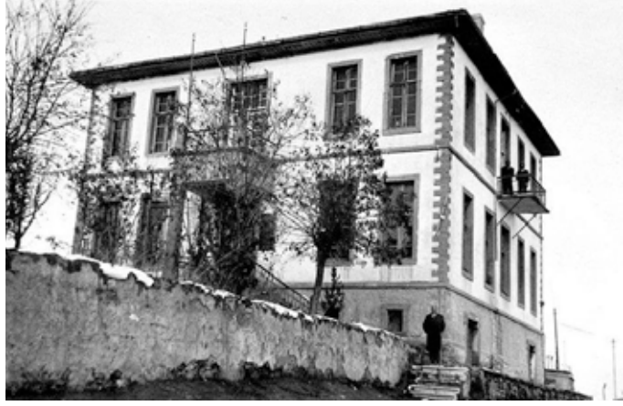
Alaeddin Tepesi'ndeki Halkevi binası.

Programın taraması verileceği için; kişi, oyun, türkü, marş adlarını ayrıca vermeyeceğiz. Salonun dolduran her yaşta Konyalının zevkle dinleyip seyrettiği bunca etkinlik başarılı bir şekilde sonra er-