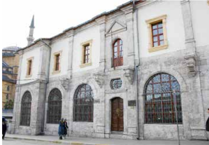
Ziya Bey Yazma Eser Kütüphanesi

Meydan Camii'nin kuzeybatı yönünde camii avlusu içerisinde yer almaktadır. Şemseddin Sivasî aslen Tokat'ın Zileli'dir. Bir çok eser kaleme almış alim ve fazıl bir zat olup, Halvetiye Tarikatı'nın kendi adıyla anılan Şemsiye kolunun kurucusudur. Türbe duvarları kesme taştan olup, iki bölüm halinde 1600 yılında inşa edilmiştir. Dıştan sekizgen bir kasmağa sahip, tek kubbeli birinci kısmında Şemseddin Sivasî'nin,