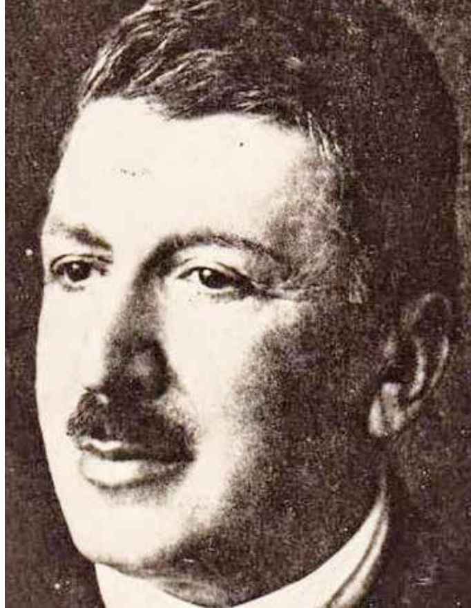
Cenap Şahabettin (1870-1934)

Leyliyye, Temâşâ-yı Hazân, Son Arzû vb. şiirlerini bugün kim okuyor? Ama onun “Kusurumuz ne kadar çoksa o kadar çok kusur ararız.”, “Kadın olsun kitap olsun cildine aldanma, müderecâtına bak.”, “Akıl yaşta değil, baştadır. Fakat akli başa yaş getirir.” gibi veciz sözleri bir araya getirdiği “Tiryaki Sözleri” adlı eseri emnim her Türk aydınının kitaplığında muhakkak vardır.