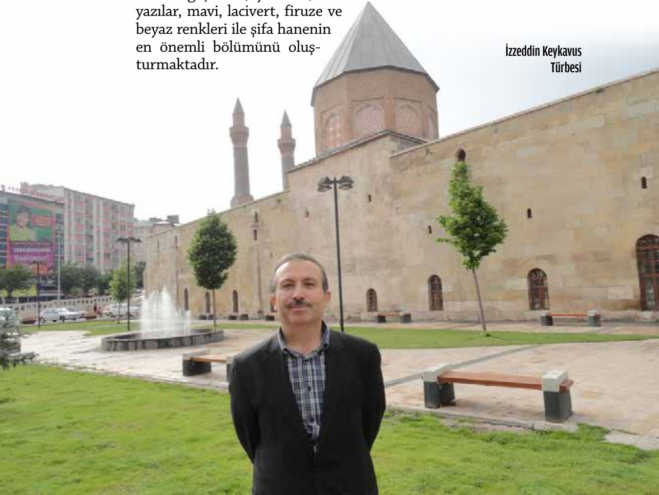
İzzeddin Keykavus Türbesi

Dönemin Sivas Valisi Halil Rıfat Paşa tarafından 1884’de yaptırılmıştır. İlk iki katı kesme taştan olan binanın 1913 yılında üçüncü katı ahşaptan yapılmıştır. Geçirdiği bir yangın sonucu yanan bina 2005’de yeniden restorasyon geçirmiştir.