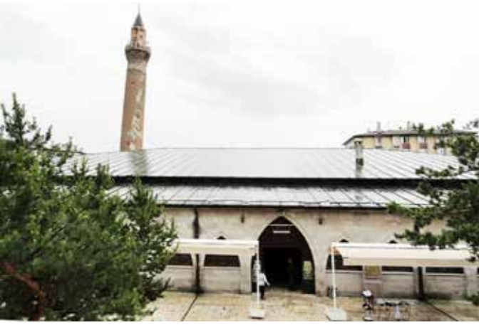
Sivas Ulu Cami

ikinci kısımda ise yirmi sanduka bulunmaktadır. Ziyaretimiz esnasında türbenin restorasyonu devam etmekteydi.