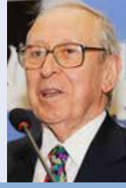
Prof. Dr. Talat S. HALMAN