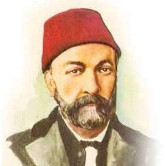
Ziya Paşa (1825 - 1880)

[Gezdiğim küfür diyarında hep düzenli beldeler, köşkler gördüm; dolaştığım İslâm top-