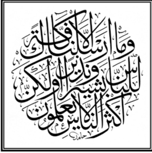
Hamid'in güzel bir celi sülüs istifi, Sebe suresi A.28