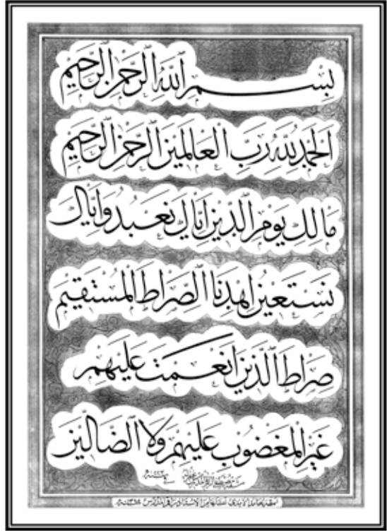
Hattat Hamid'in yazdığı Fatiha suresi

da orada gösterelim" der. Beraber giderler. Sohbet esnasında o zat "- Efendiler, şöyle bir Fatiha Suresi var bir bakın" der ve oradakilere uzatır. Elden