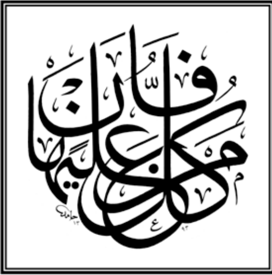
Hamid'in güzel bir celi sülüs istifi Rahman suresi A.26,