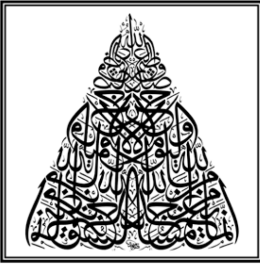
Şişli camii Taç Kapısı yazısı, Tevbe suresi, A.18