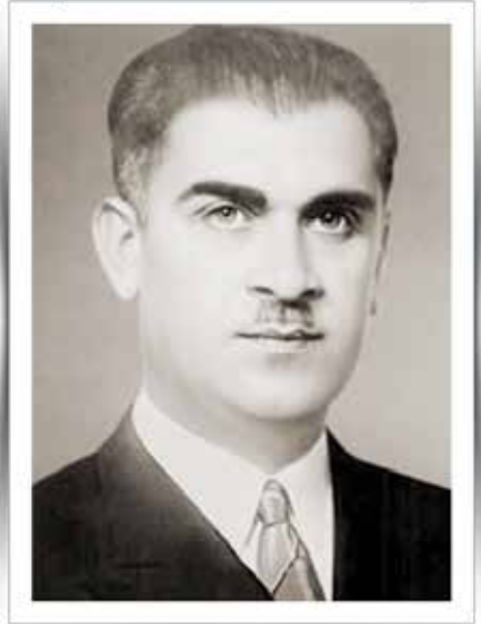
Hasan Ali YÜCEL (1897-1961)