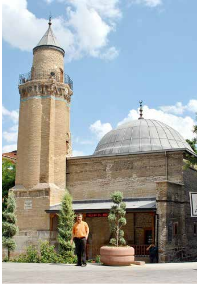
Konya'da Hoca Hasan Mescidi.

Konya'da İhtiyareddin Mahallesi (3) , mahalle birleştirmeleri sırasında Sahipata Mahallesi'ne dâhil edilmiştir. Artık bundan sonra ne İhtiyareddin Mahallesi ve ne de İhtiyareddin Hasan hatırlanacaktır. Mahallenin ve İhtiyareddin Hasan'ın unutulmaması için mescidin (4) doğusunda bulunan boşluğun uygun bir yerine İhtiyareddin Hasan ile ilgili bir makam kabrinin yapıl-