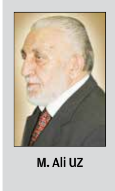
M. Ali UZ

veziri İhtiyareddin Hasan'ı Selahattin Eyyübi'ye elçi olarak gönderir. İhtiyareddin Hasan, Selahaddin Eyyübi 'ye, büyük bir sultan olduğunu Haçlılarla barış yaparak gazâyı bırakarak cihat ruhuna aykırı hareket etmesinin İslam sultanına karşı harekete geçmekle kendisine yakışmayan bir davranışta bulunmamasını