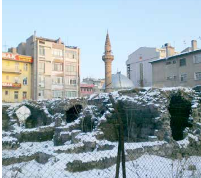
Kayseri'de Hoca Hasan Medresesi harabesi ve geriplanda Hoca Hasan Camii.