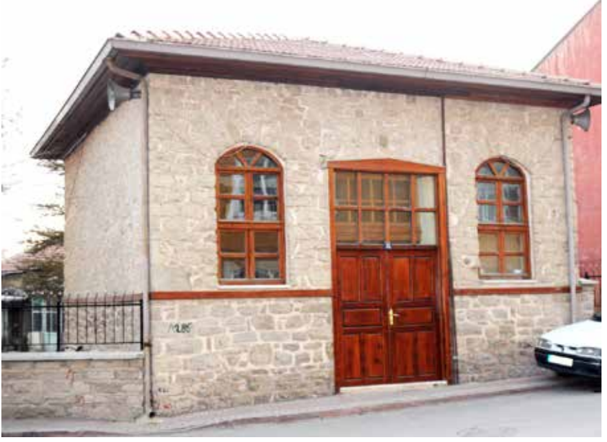
İhtiyarettin Mescidi, Meram - Konya.

münasip sözlerle anlatmıştır. İhtiyareddin Hasan, Haçlılarla sulh yapıp II. Kılıçaslan üzerine yürümeye hazırlanan Selahaddin Eyyubi'yi tesirli sözlerle ikna ederek iki İslam ülkesi arasındaki olası bir savaşı önlemiş olur. Bu barış aynı zamanda Ermeni ve Haçlılara karşı yapılacak mücadelede iki kuvvetli sultanın birlikte hareket etmesini sağlar. Bu, İhtiyareddin Hasan'ın en büyük başarılarından birisidir. İhtiyareddin Hasan bu meseleyi halletmemiş olsa idi bir İslam devleti ile cihatları ile tanınan bir İslam kumandanının arasında çıkacak savaşın ne büyük bir felaket olacağı aşikârdır.